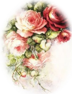
Ingunn Elisabeth Lillefjære

Intervju med en av våre eldste Norasøstre