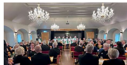
«Porsblomsten» i aksjon

Loge 47 Grenmar er sponsor for et lokalt demenskor, «Porsblomsten» og overskuddet av arrangementet gikk til dette koret. Etter forestillingen ble vi servert pizza og demenskor underholdt.