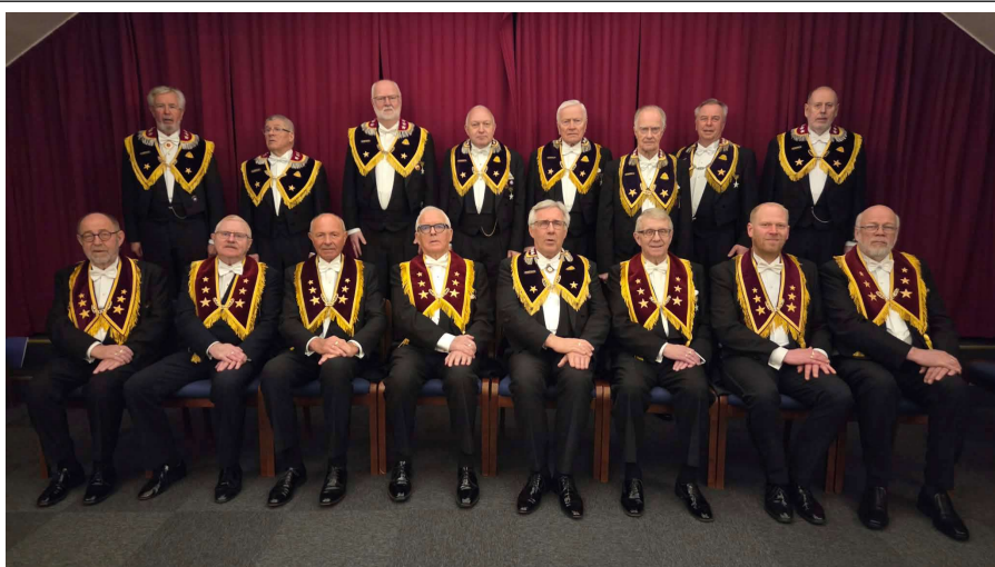
Fungerende Storembedsmenn og våre nye brødre av Storlogegraden