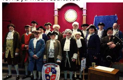
Aktørene i full mundur i den store logesalen i Stavanger

Over 100 søstre og brødre deltok og alle, både gjester og aktører var fornøyd med resultatet.