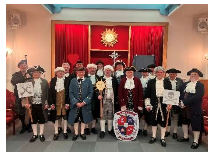
Aktørene poserer i salen etter forestillingen