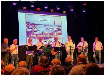
Østre Gab med bilde av østre gab i bakgrunn

Pelles venner lanserte filmen om « DS Pelle » i Lille Torungen på Kulturhuset Onsdag 29. april.