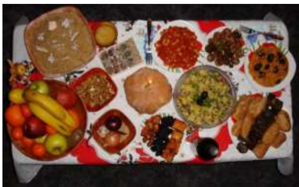
12 retter på bordet

Stikk i strid med norsk tradisjon så er det store bugnende matbordet forbeholdt Nyttårsaften. Det skal være 12 ulike retter som tilberedes og serveres ved middagsbordet, hver av dem skal betegne rikdom og velstand for de kommende månedene. Disse rettene kan være ulike kjøttretter, bønner, forskjellige typer nøtter inkludert valnøtter, svsker, kaker og den tradisjonelle Banitza. Noen få familier spiser likevel dette måltidet på julaften, men i de senere årene har stadig flere flyttet feiringen til Nyttårsaften i stedet.