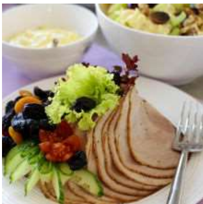
Roastbeef er alltid populær.

Koldtbord, buffet eller tapas, – kjært barn har mange navn. Det fantastiske med å servere denne typen mat er at det bare er fantasien og kapasiteten som setter grenser for hva man kan dandere på fat og i skåler. Det finnes selvsagt enkelte som har klare ideer om hva som skal være på et tradisjonelt koldtbord eller hva man skal servere på en spekematbuffet. Men, det finnes jo strengt tatt ingen skrevne regler! Og det er lov til å jukse masse. Det meste som hører hjemme på en buffet finnes i butikken. Det går også an å bestille en “standardmeny” fra catering, og så supplere med noen hjemmelagete retter som vil imponere gjestene.