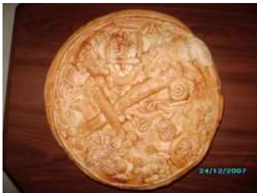
Bulgarsk julebrød i plassert sølvmynt

sitter fast på stokken. Bortsett fra dette tenner mange bulgarere et bål og lar det brenne hele natten. Dette er en historisk tradisjon som skal bringe hell og lykke og gjøre håp til virkelighet.