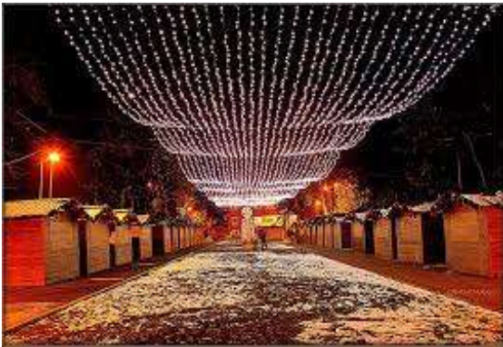
Julemarked i Veliko Tarnovo

i lønningsposen i stedet for å se at sårt tiltrengte offentlige midler blåses opp i røyk.