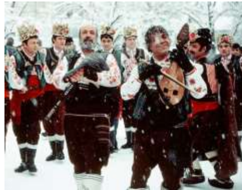
Koleduvane i Bulgaria

Hva er så konklusjonen på dette mitt inserat skrevet en novembermandag i påvente av at sola skal brenne vekk morgentåken. Julen 2014 vil ikke bli feiret av meg her i Bulgaria. Takket være en svært imøtekommende familie i Norge, kjører jeg bil til Norge for å være sammen med sønn og ekskone i julen. 13. desember er jeg bak rattet de 250 milene til Kiel og deretter ferjen til Oslo. Skal bli godt å komme hjem til Norge igjen til jul. Man vet ikke hva man har før man mister det. Så får jeg ta vare på den bulgarske tradisjonen og karre meg tilbake igjen før den 31. desember. Det skal nok bli hyggelig det også.