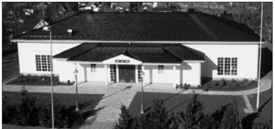
Vårt nye hus slik det tar seg ut per i dag.

Det har vært stor interesse for lokalene, så det lønner seg å være tidlig ute med å bestille huset.