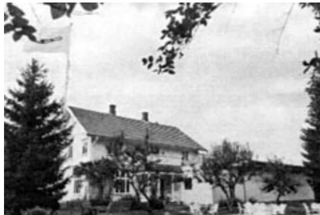
«Gamle» Villa Nore, slik vi alle husker det.