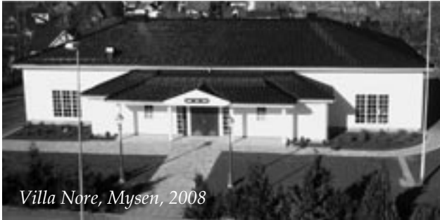
Villa Nore, Mysen, 2008