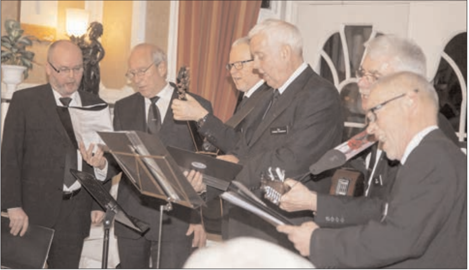
Husorkesteret til Torungen underholdt oss med smektende toner