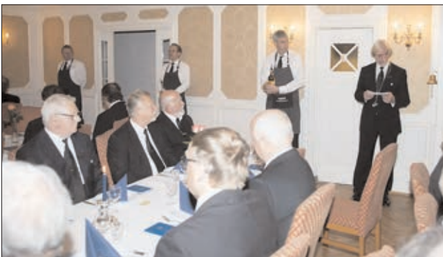
Så er det like før serveringen er i gang

To eldre herrer som bodde på samme rom på hjemmet. De fortalte alltid hvordan de hadde det på godt og vondt. Begge var veldig opptatt hva de hadde drømt om natten. Da sier den ene: I natt hadde jeg en fantastisk drøm. Hva var det du drømte? Jo jeg var på sykkelstur til Stavanger i det fine vår-været, fine blomster langs veien, og mange hyggelige menneske traff jeg på, og for ikke å glemme det fine været. Så sier den andre: Jeg hadde også en fin drøm i natt. Hva drømte du? Jo når vi hadde gått til sengs i går kveld, kom det to frodige og flotte damer inn på rommet vårt, og vi hadde det så hyggelig gjennom hele natten. Men, hvorfor i all verden vekte du ikke meg svarte den andre, Nei det var ingen vits fordi du var jo på sykkelstur til Stavanger.