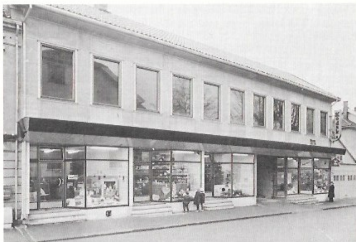
Nedre Torggt. 1 — Odd Fellow-gården

eiendom tilbudt oss for 165.000 kroner. Det hadde også sin forhåndshistorie.