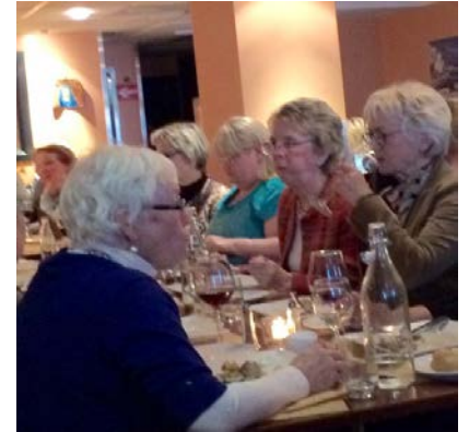
God mat , og god stemning.

Torsdag 8 april hadde søstrene i 116 Navigare en fantastisk kveld i Arendal Kulturhus. Hele 52 søstre var påmeldt. Vi kjørte samlet i buss til Arendal der vi hadde bestilt bord på restauranten Symposium, hvor vi spiste god gresk mat, i en hyggelig atmosfære