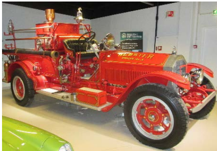
For redaktøren, men 22 år bak seg i brannreserven, ble brannbilen fra 1919 en stor opplevelse

Det ble en minneverdig stund, der vertens entusiasme smittet over på deltakerne, og ingen dro derfra uten et ønske om å kunne komme tilbake og høre mer.