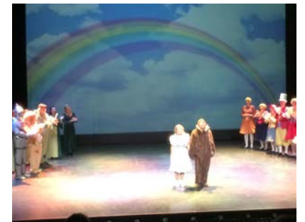
Mange flinke, lokale skuespillere

På kulturhuset opplevde vi premieren på forestillingen Trollmannen fra Oz. En flott forestilling med gode skuespillere og flotte kostymer. Takk til initiativtakerne for en flott tur!