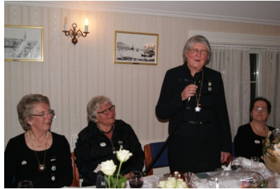
Den spreke jubilanten holdt en flott tale der hun takket for kveldens seremoni og taffel.