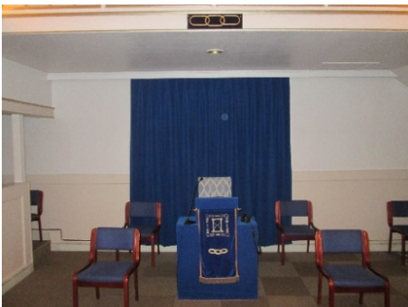
UM-kateter m/ de tre kiedeledd

De to universene er: Leiren og Logen, begge likeverdige innenfor Ordenen, men med flere «ulikheter». Det mest synlige er Logens kvadratiske form med alteret som midtpunkt, innendørs , mens Leiren er sirkelformet med bålet som midtpunkt, utendørs . Kjell-Henrik Hendrichs tok også for seg regelverket for Ordenens logesaler, der logen ledes fra 4 stoler, også kalt katetre , plassert i øst, vest, nord og syd. Det er fra logens katetre at alle belæringar gis til Ordenens medlemmer. Den følgende del av seminaret hadde til formål å skape en « idédugnad » både om hvordan saler har sett ut og hvordan de kan bli.