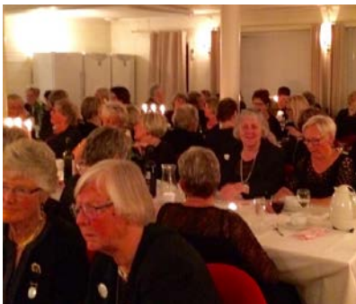
Praten gikk livlig rundt bordet.

Vi hadde innvielse denne kvelden, og fikk 2 nye søstre. Dette ble en festkveld vi vil huske lenge, sjelden vi er så mange søstre samlet i vår Loge.