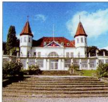
Odd Fellow Palæet, Varma, Århus.

en pæn tilgang – og så er det som med frøet der bliver lagt – at pludselig er der vækst. Vi håber og tror på, at vi kan bevare vort venskab – at det frø, der for mange år siden blev lagt, atter må spire og udmunde i et besøg i vor venskabsloge «VIKEN» NR.32 i Oslo. Embedsmænd og brødre i BRODERLOGE NR.14 «SCT.OLAF» ønsker vor venskabsloge ODD FELLOW LOGE 32 «VIKEN» i Oslo hjertelig tillykke med 50 års jubilæet den 24. november 2000, med ønsket om glæde og vækst til gavn for jeres loge og for vor Orden.