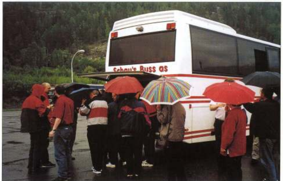
Det er noe som foregår både i godt og i dårlig vær.