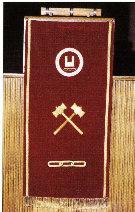
Antependiet til OM-stolen.

kortsiktige. Gjennomførbare og oppnåelige mål. Trygge rekrutteringen, engasjere nye og gamle medlemmer. Oppfordre til hver enkelt om å være initiativrike. Ta oppgaver som blir forelagt deg. Ta selv initiativ for å berike din og andre brødres deltagelse i logearbeidet. Jeg vil takke alle brødre som har bidratt til at vi i jubileumsåret har nådd vårt mål med mer enn 100 medlemmer i Loge Viken. Videre vil jeg takke initiativtakerne til at Loge Viken i jubileumsåret står som Moderloge for Broderforeningen «Oslo Broderforening». Viken vil fortsatt være en livskraftig loge med en fortsettelse av den av Brødrenes stadig søken etter nye frø som kan spires i logen. Dette kan medføre til at Loge Viken blir en stamme med flere grener enn Oslo Broderforening og dermed bidra til utviklingen av Odd Fellow Ordenen. Igjen gratulerer jeg Loge nr. 32. Viken til lykke med 50-års jubileet og ønsker lykke og fremgang med tiden som kommer.