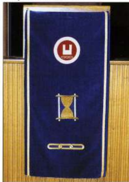
Antependiet til UM-stolen.