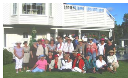
Søstrene i 116 Navigare, med gjester.