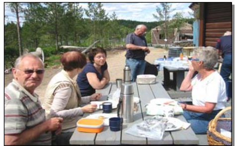
Glade mennesker på Kiland