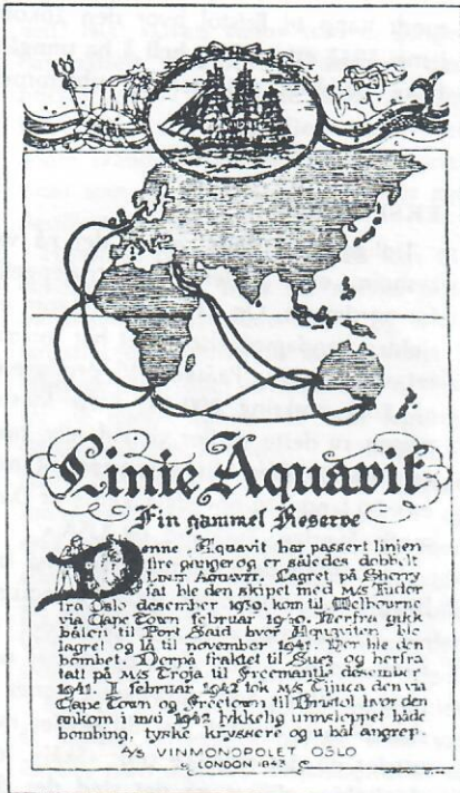
Etiketten for den omtumlede «Bombeaquavit».

Og her følger leserbrevet i samme avis noen dager senere. Under overskriften «Eventyrlig Aquavit-fortelling.»