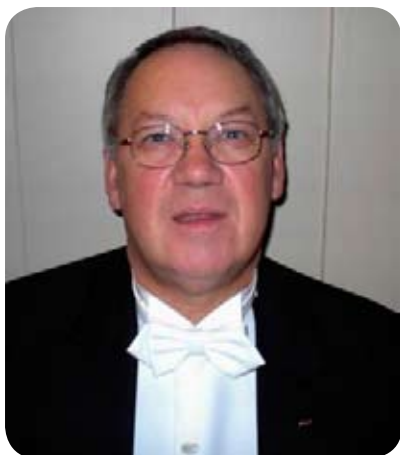
Overmester har ordet