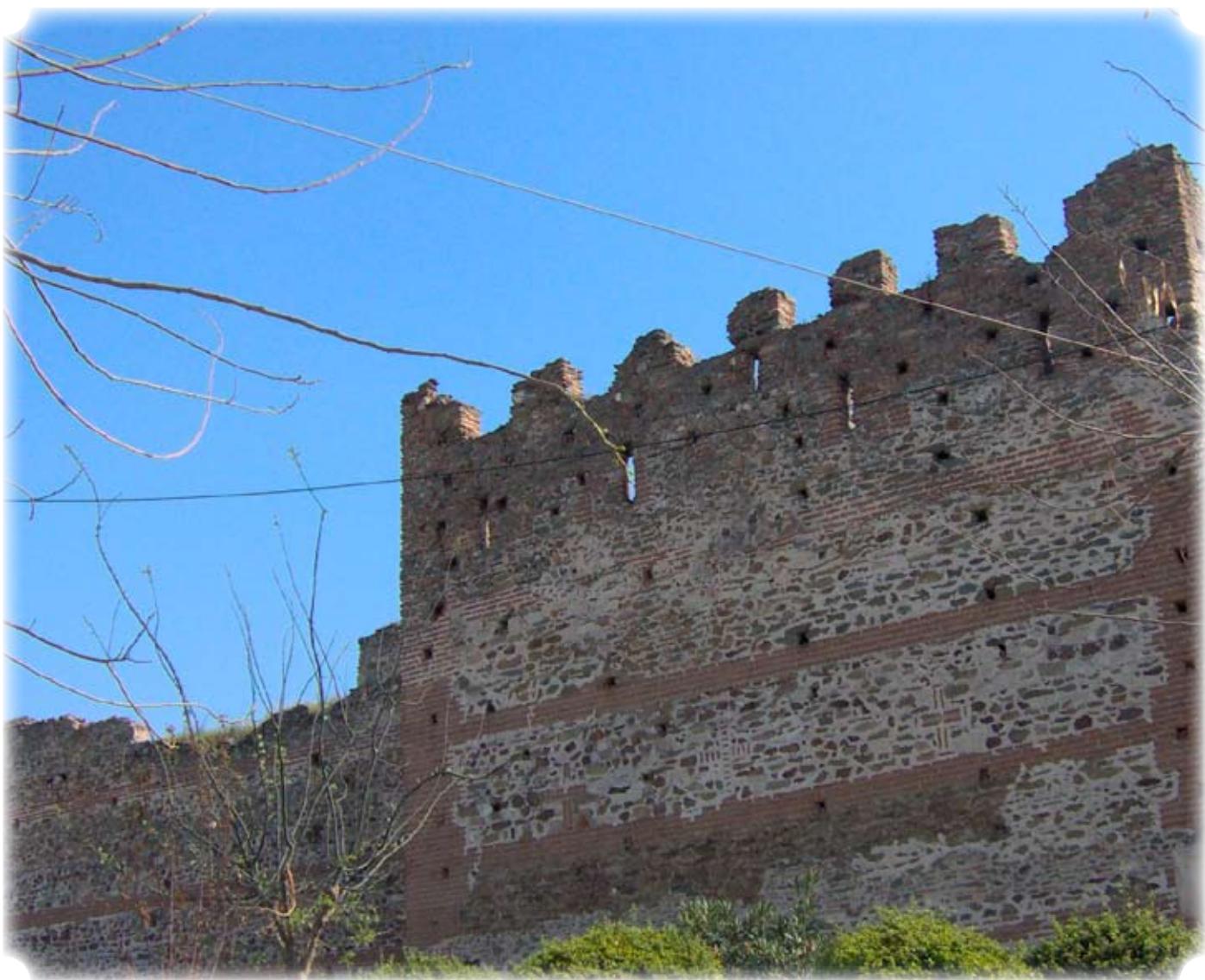
Motiv fra Bymuren i Thessaloniki, Hellas. Eldste del er antageligvis fra ca 1000 f. Kr.

Innhold: s2: Overmester har ordet. s3: Støttestenen gratulerer, Besøk i Viborg. s5-7: "Utsiden av Hurtigruten", Moralisme og fordommer. s8: Installasjon 2009 s9: Om å komme hveandre nærmere, O, brother where art thou? s10: En vinneres bekjennelse.