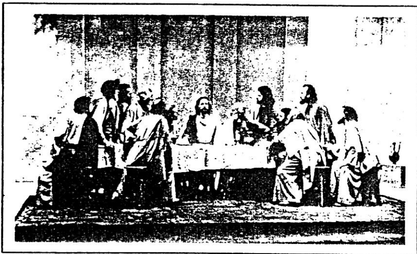
Et tablå med Den siste nattverd

altfor overtroisk, altfor gammeldags og amatørmessig. Lederne for jødiske organisasjoner i Tyskland, Storbritannia og De forente stater har dessuten beskyldt skuespillet for å være antisemittisk. De protesterer mot visse avsnitt, for eksempel disse ordene i scenen med Pilatus: «Hans blod komme over oss og over våre barn!» Også i Oberammergau har det hevet seg sterke røster for at teksten må revideres. Men flertallet av byens innbyggere er like urokkelige som de urgamle fjellene omkring dem. «Det er vårt spill,» sier de, og er både forbauset og forbitret over at fremmede prøver å blande seg opp i deres anliggender.