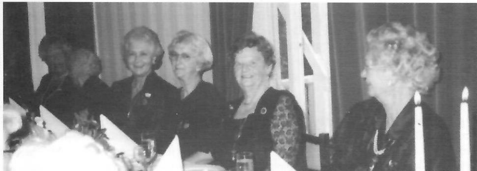
Fra hovedbordet v/Fortuna's 20-årsjubileum.