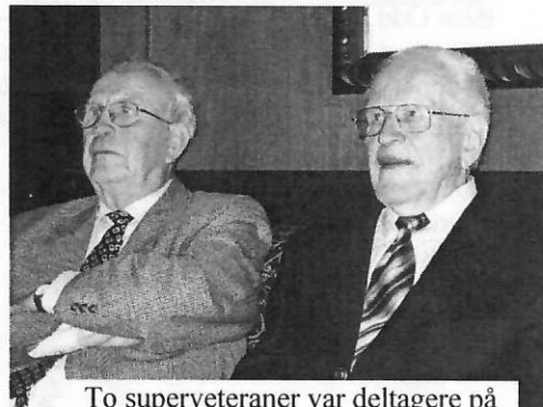
To superveteraner var deltagere på seniortreffet.

Til sammen 48 seniorer inkl. sine respektive fra Lillesand i vest til Tvedestrand i øst, dro søndag 22.01.06 på et fantastisk cruise fra Oslo til Kiel. Returen var tirsdag 24. januar. En fantastisk båt og en like fantastisk reiseleder og sjåfør Thorbjørn Ribe.