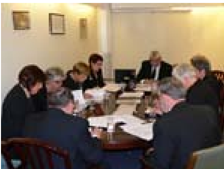
Våre 2 DSSer arbeidet i gruppe