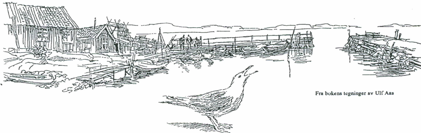
Fra bokens tegninger av Ulf Aas