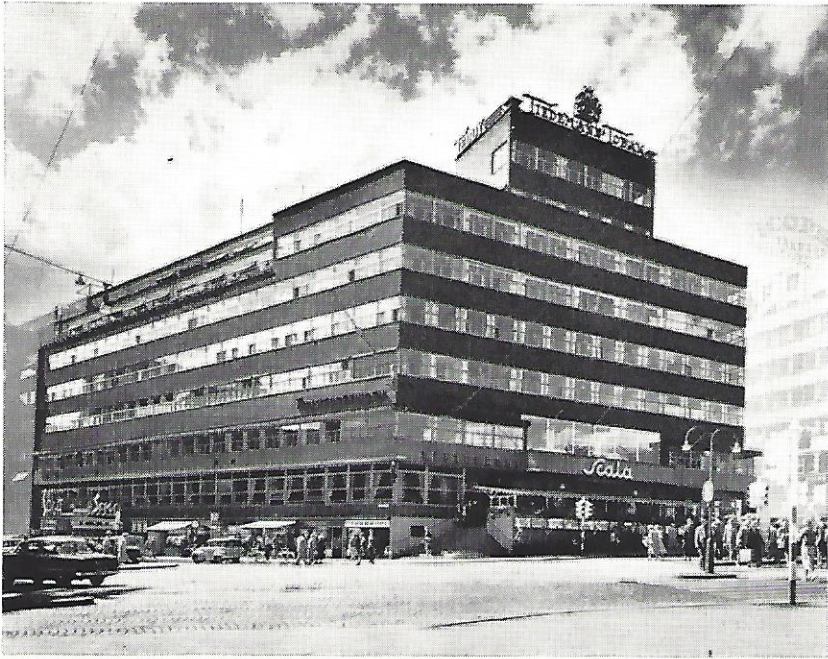
Odd Fellow gården i Oslo.