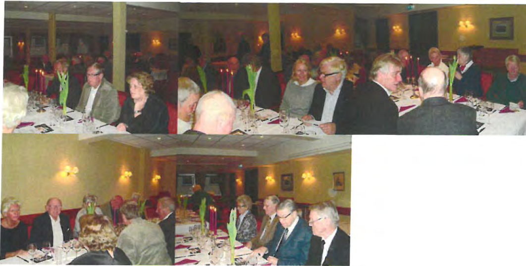
Forventningsfulle brødre og gjester finner sine plasser