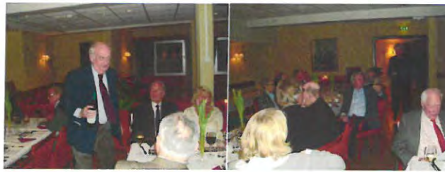
Privatnemdas medlemmer følger med og ser til at alle finner seg til rette