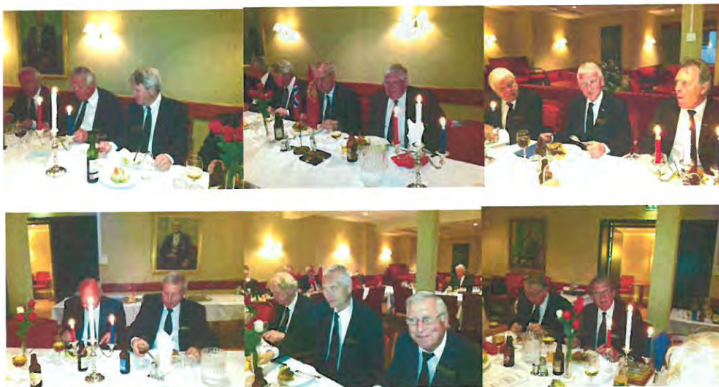
Brødrene nyter samvær og de gode smørbrød.

Privatnevnden hadde også denne gang gjort gode forberedelse, og de gode relasjoner med kjøkkenet ble igjen bekreftet.