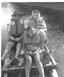
Bambus flåte rafting på Rio Grande