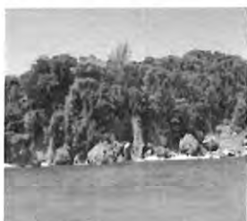
Utenfor The Blue Lagoon

Barn begynner på skolen når de er 2 år og alle bruker skoleuniform. Fordi det er få skoler i forhold til hvor mange elever det er, så er skoledagen delt i to for elever og lærere, altså en skift ordning. Første skift er kl 07.00 – 12.00 og andre skift er kl 12.30-17.30. Det er ca 50 elever i hvert klasse. Alle går på skolen til de er 16 år, det finnes også college og universitet.