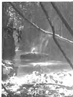
Somerset Falls Rain Forest