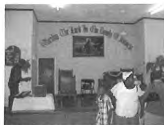
Kirke i Browns Town