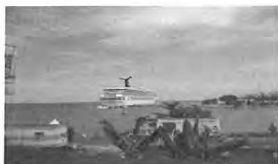
Cruise Ship i Ocho Rios