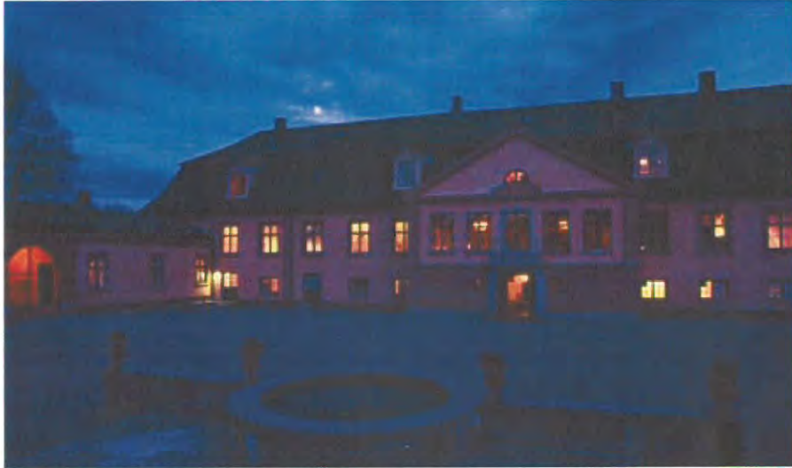
BOGSTAD GÅRD 31. AUGUST 2011

Som kulturhistorisk minnesmerke rangerer Bogstad svært høyt i nasjonal sammenheng, et autentisk innredet hjem som står delvis urørt fra slutten av 1700-tallet. Godseier Peder Anker var Norges første statsminister i Stockholm etter 1814. Han og hans etterkommere, familien Wedel Jarlsberg, spilte på slutten av 1700-tallet og begynnelsen av 1800-tallet en viktig rolle i norsk historie. Godset ble privat eiendom i 1649 og tilhørte slekten frem til 1955. Anlegget drives i dag som museum.