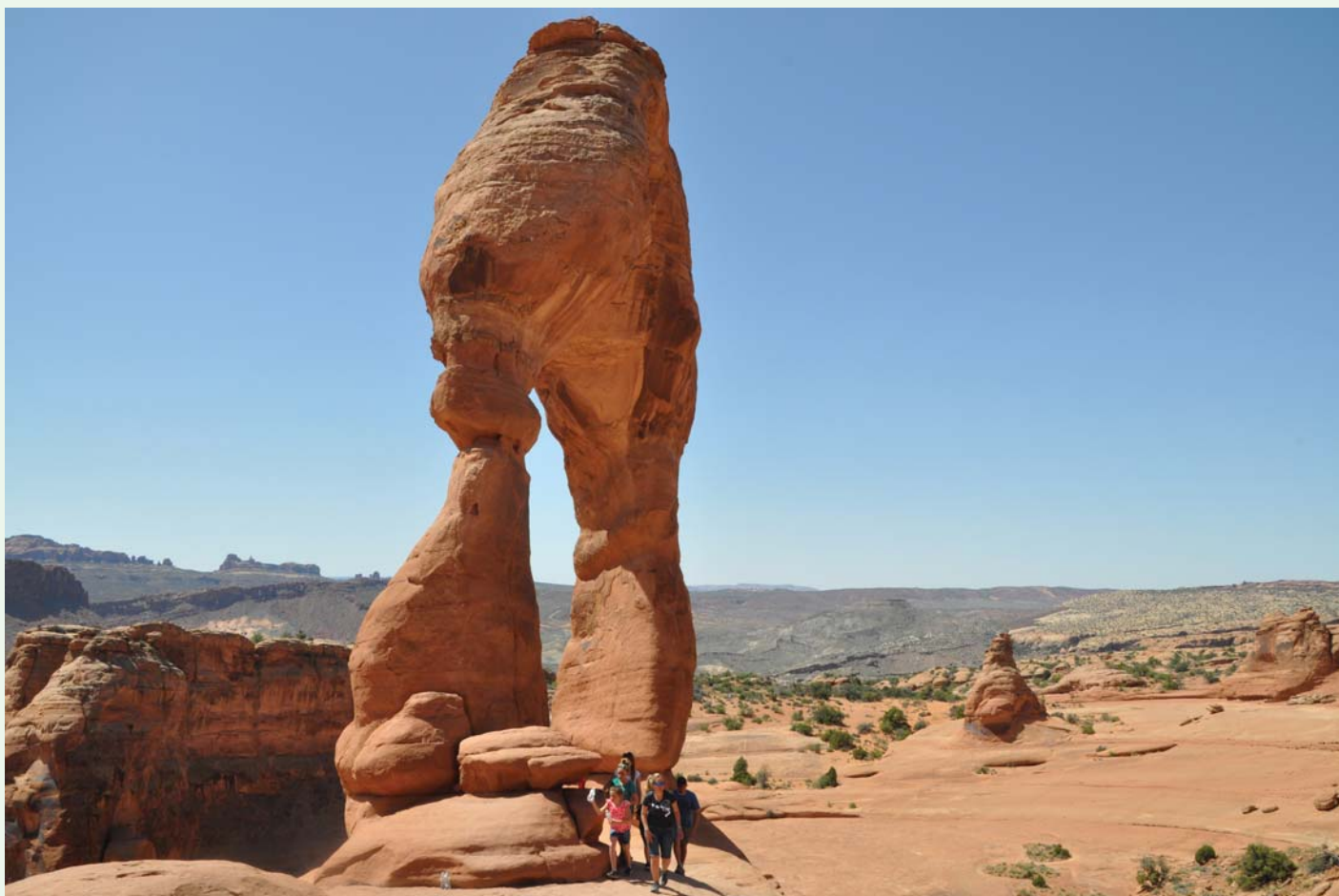
Fra fjellformasjon i Utah

i Houston – noe som brakte oss i selskap med hyggelige folk ute på restaurant. Vi fikk også med oss et besøk på et romfartssenter litt utenfor Houston.