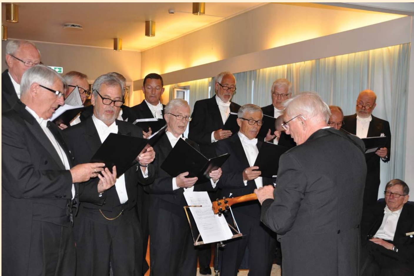
Odd Fellow Koret, Gjøvik

Vi tar fram et velvalgt dikt av Haldis Moren Vesaas som vi mener passer godt til våre jubilarer. De kan se tilbake på et langt livsløp som aktive brødre i Ordenen.