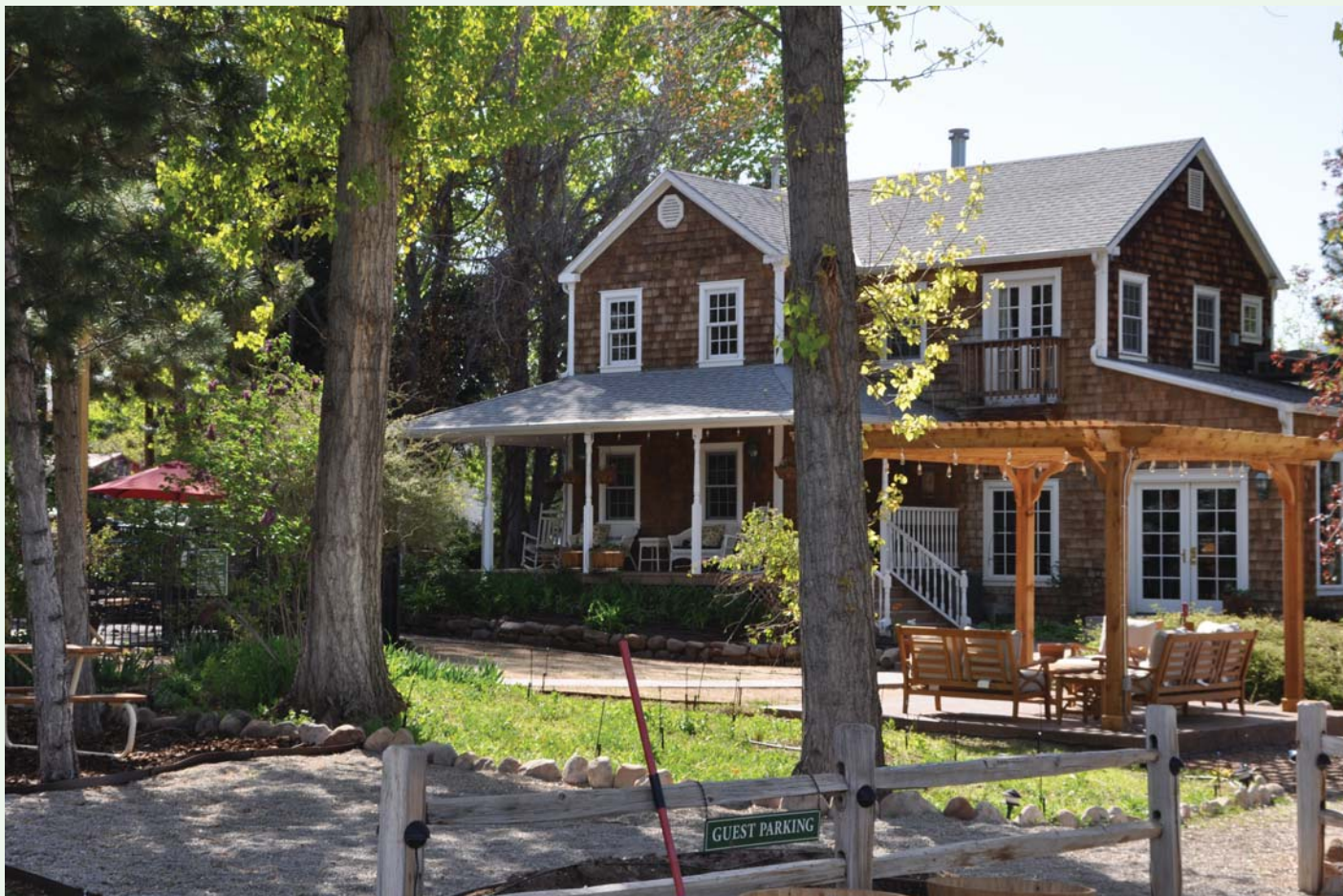
Vårt lille hotell i Mohab, Utah