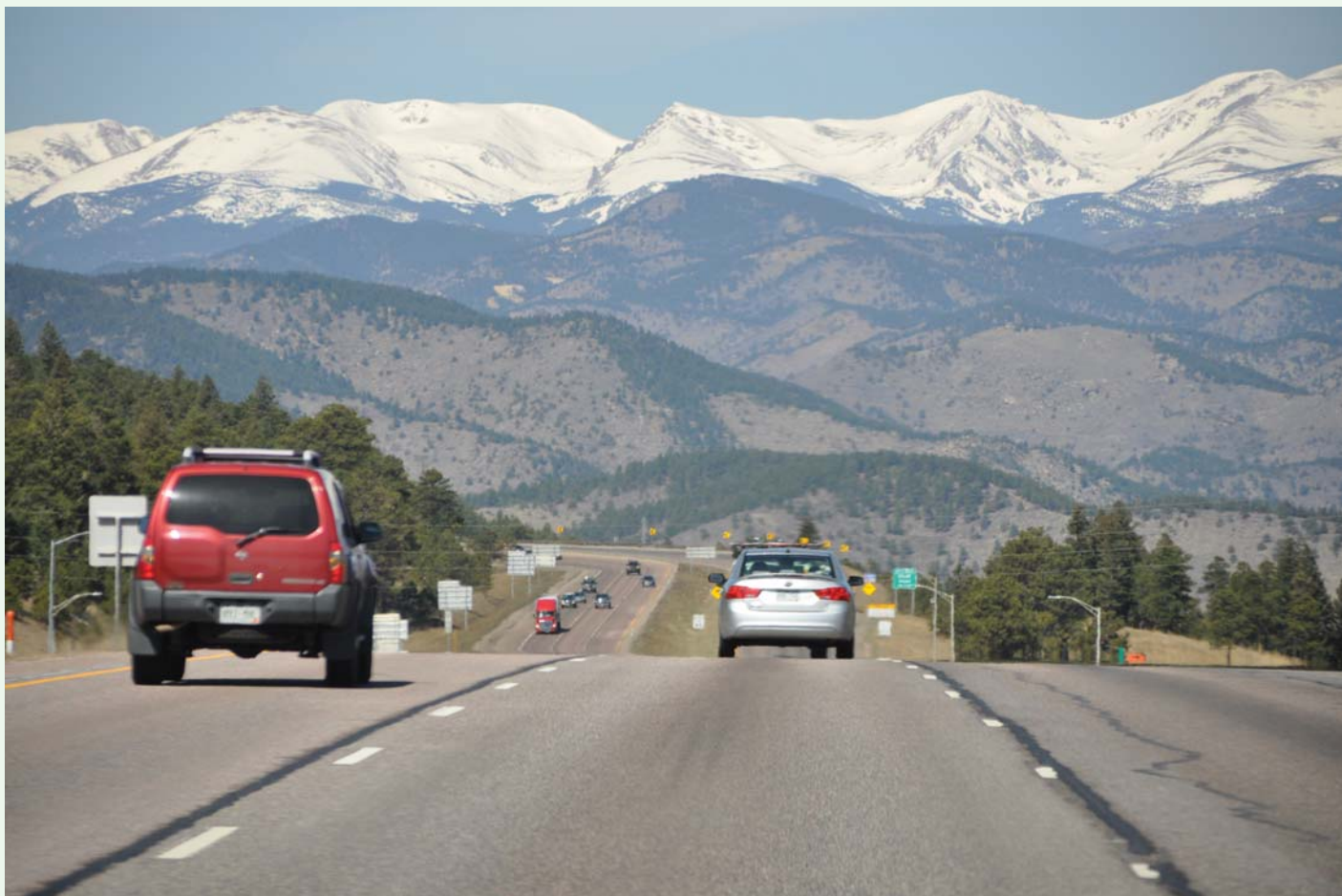
Fra Rocky Mountains

Vi snakker ikke om en dagligdags tur/retur til New York over en langweekend. Reisen med fly fra Gardermoen – flybytte i Amsterdam og landing i Houston i Texas med fly tilbake etter tre uker fra Los Angeles gir oss mange forestillinger og forventninger fra 2017. Historien om at fattigdom og sult fikk tusenvis av tidligere generasjon nordmenn inkludert egne slektninger til å ta farvel med Norge for godt er spennende nok. Det forjettede land tok i mot utvandrerne og skulle gi dem bedre levekår enn det armodens hjembygd kunne by. Det ble også færre rundt matfatet for de som ble igjen. Likevel – forberedelser våre forfedre gjorde til den store Amerika-reisen ble ikke gjort uten videre på «appen» De regnet aldri med å komme tilbake til moderlandet igjen. Selv slapp vi på avreisedagen å entre en seilskute over Atlanteren - trappa opp til KLM-flyet ble for oss det første steget til Amerika. En uke i åpent hav med ulik bølgehøyde, sykdom og vekslning mellom håp – angst og uvitenhet om hva som ventet, det gir et håpløst sammenlikningsgrunnlag med den turbulensen som kan oppstå i 12.000 meters høyde over 9 timer.