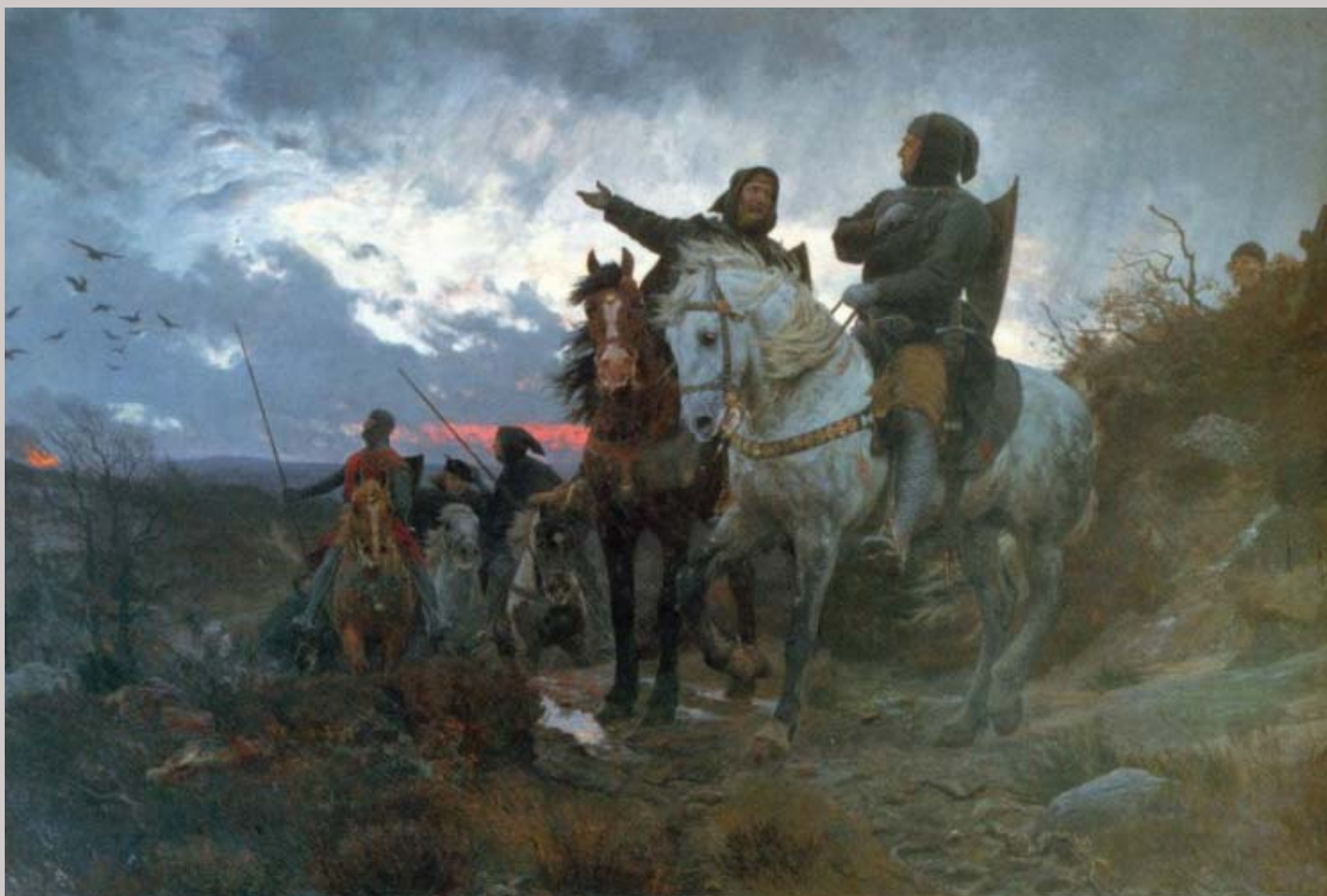
Otto Bache: De sammensvorne rider fra Finderup

På denne måde har vi nydt at finde de fejltrin og misforståelser, der opstod i logens seneste år, og haft megen morskab efter Danehof, og nu vil vi mindes straf og synder med et smil og en sjov bemærkning.