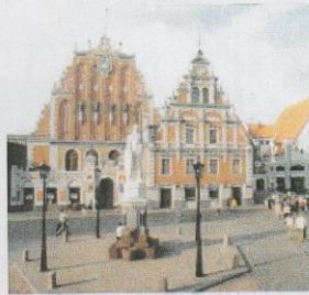
Torvet i Riga

I Riga fikk vi guiding av Giljana og tid til å vandre rundt i byen og beundre de mange vakre bygningene i Art Nouveau-stil som ble bygget sent på 1800-tallet. Riga var i sin tid Sovjetsamveldets femte største by og den tredje største i den baltiske region i 1914 (bare St. Petersburg og Warszawa var større). Vi bodde på det flotte SAS Radisson Daugawa hotell, og hadde en god spasertur over broen og inn til gamlebyen om kvelden, smakte både på godt øl og Riga Balsam!