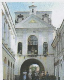
Byporten til gamlebyen i Vilnius