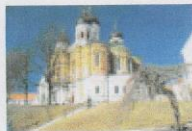
Russisk ortodokse katedral i Tallin