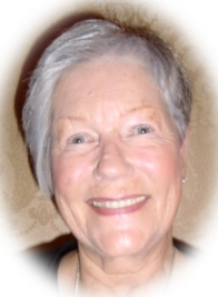
Else Aafos Det Gode Vennskaps Grad 9/1 Den Edle Kjærlighets Grad 11/9