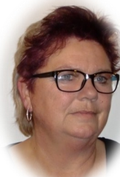
Hanne Augustin Barmhjertighetens Grad 26/2