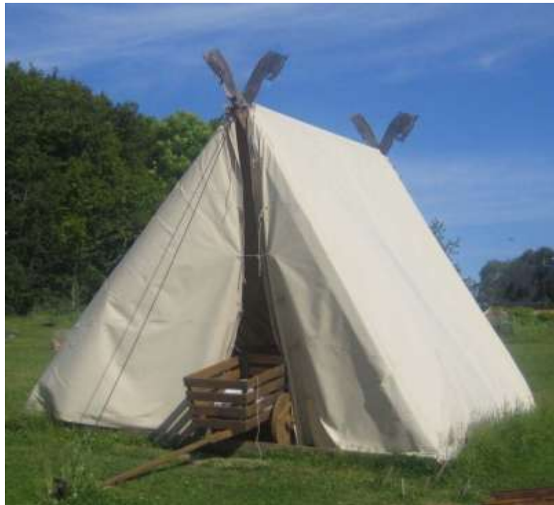
Modell av vikingtelt satt opp på Kaupang ved Larvik.

Teltet i logoen symboliserer våre leirslagninger. Som motiv var det naturlig å bruke det vikingtelt som ble funnet i Osbergskipet fra ca 800-tallet. Det var stort: ca 5,3m x 4,5 m og 3,8 m høyt. I forbindelse med de store utgravningene på Kaupangfeltet ved Larvik ble det satt opp modeller av denne type vikingtelt.