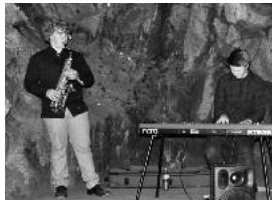
Stemningsfull musikk fra Katedralen.