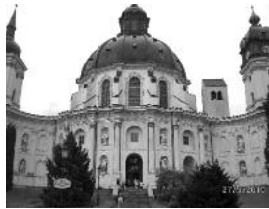
Klosterkirken i Ettal.

Så er vi kommet til turens høydepunkt. Den 28. mai reiste vi fra München til Garmisch-Partenkirchen for innsjekking på hotellet. Etter en spaseretur og lunsj i byen, reiste vi til Oberammergau og inntok våre plasser i teateret. Vi var svært spente, og etter forestillingen som er omtalt tidligere, var vi alle preget av det mektige vi hadde overvært. Så den 29. mai lå en lang busstur foran oss, fra Garmisch-Partenkirchen til Lübeck, en 13-timers tur. Vi ankom Lübeck ca. kl. 21, og etter mid-