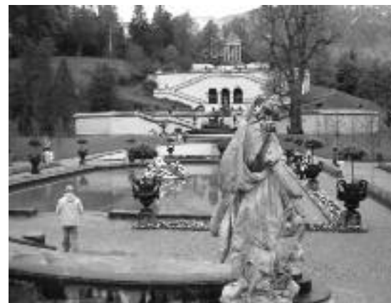
Fra hageanlegget på Schloss Linderhof.