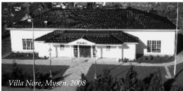
Villa Nore, Mysen, 2008