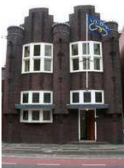
Logehuset i Groningen

19. mars 1877 ble den første broderloge i Nederland stiftet. Først etter 22 år ble det stiftet loger utenfor Amsterdam-området, og da i Haag og Groningen.