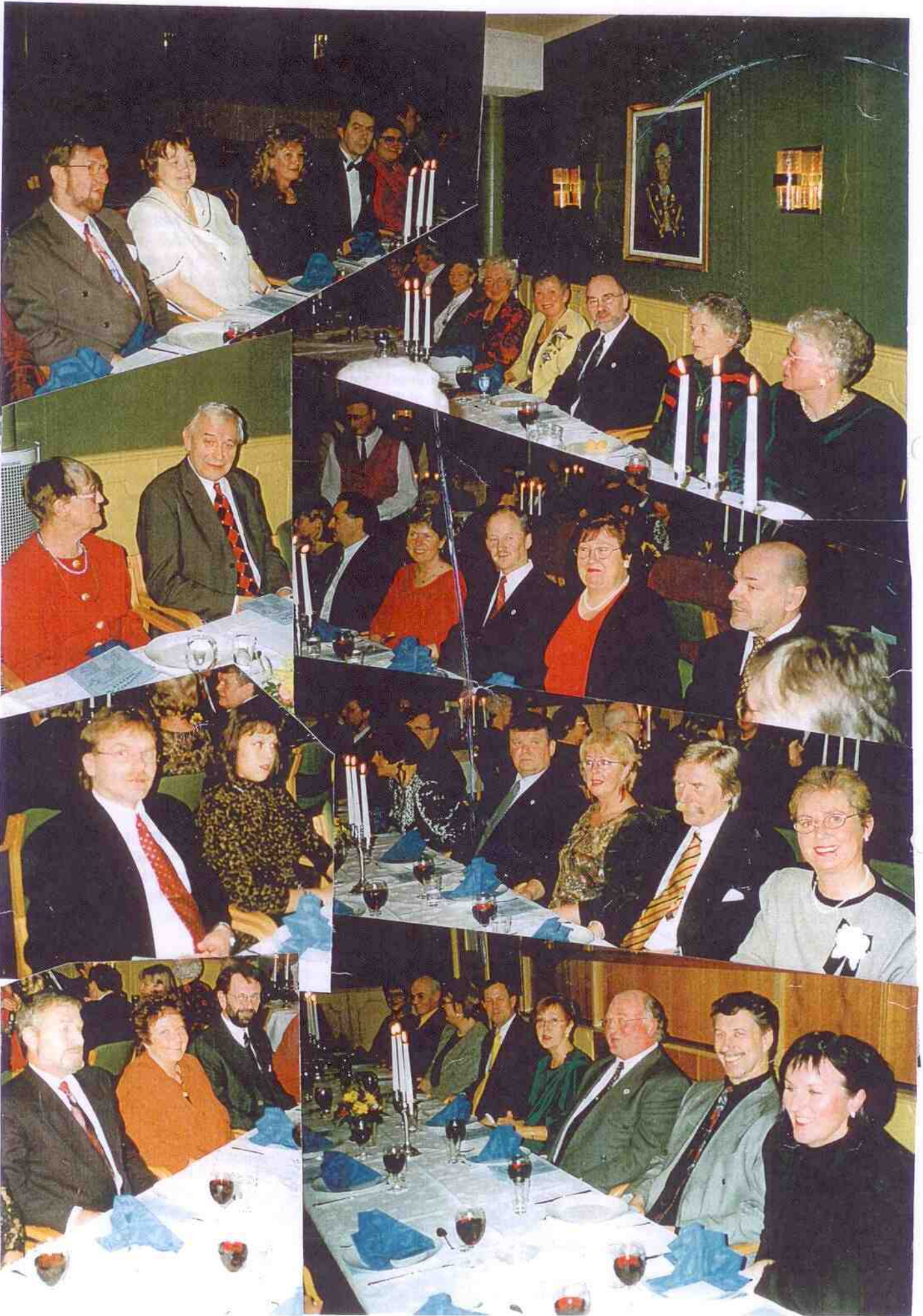
Noen bilder av glade festdeltakere på årets solfest