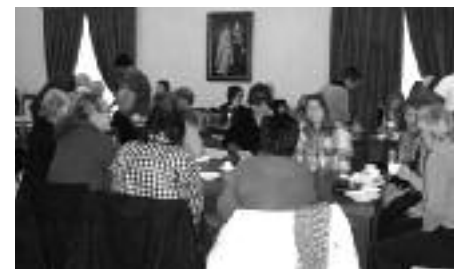
Kafeen gikk strålende og folk koste seg.