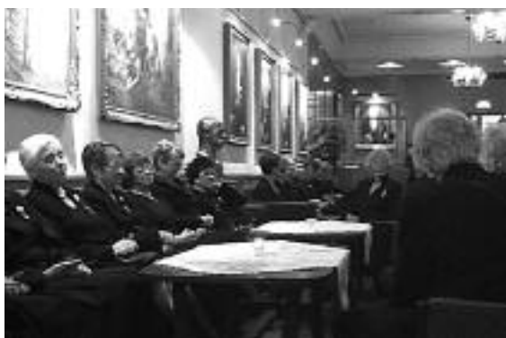
Logesøstre fra vår egen loge på besøk i Loge nr. 102 Constantia i Oslo.