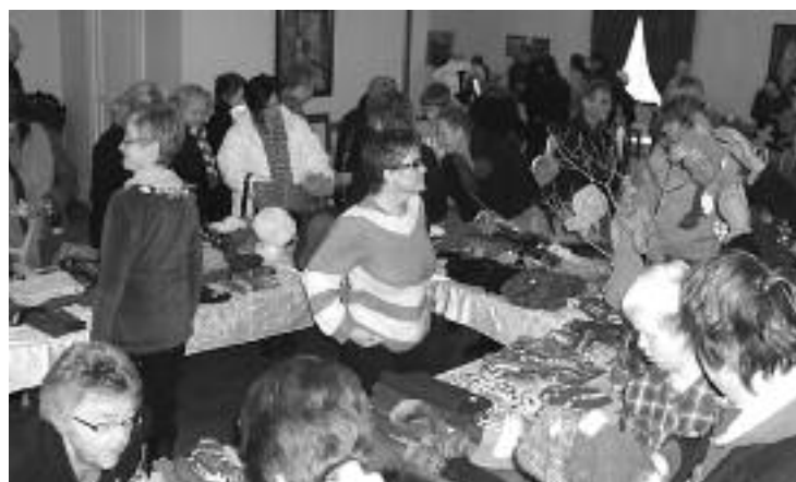
Stor aktivitet og masse mennesker besøkte messen som ga et godt overskudd til hjelp og støtte for mange.