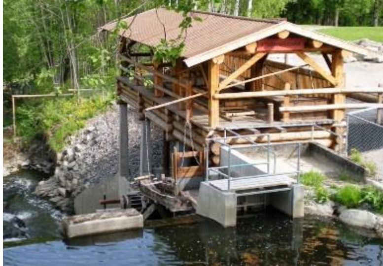
Kopi av vannsag plassert i Sagelva.