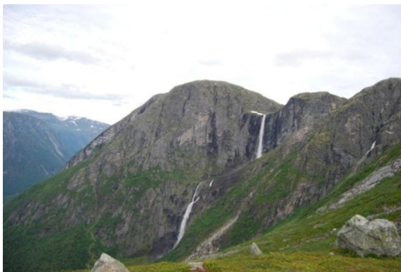
Mardalsfossen, det høyeste fallet er 358 m, Total fallhøyde er 657 m.

Når de første dagene med mer eller mindre intens fiskeing er over, setter vi ofte kursen til fjellet. I vårt ferieparadis er det flere muligheter til det, både på Lesja, på Dovre og i Bjorli området. Flere ganger har vi pakket sekken med mat og stormkjøkken og satt kursen inn til Mardalsfossen. Det er et vakkert skue å sitte på "vårt" platå 6-700 m over Eikesdalen og Eikesdalsvannet og se fossen der den stuper ned. For å komme til fossen må vi først kjøre den gamle anleggsveien og passere det området hvor demonstranter lenket seg fast for å forhindre utbygging av Mardøla vassdragene.