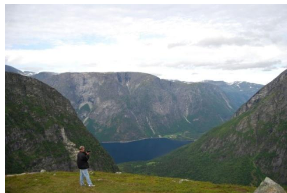
Eikesdalen og Eikesdalsvannet

Vi må alle verne om naturen slik at nye generasjoner også får oppleve den friheten. Man må ikke alltid reise langt for å oppleve natur, vi har den rundt oss, bruk den.