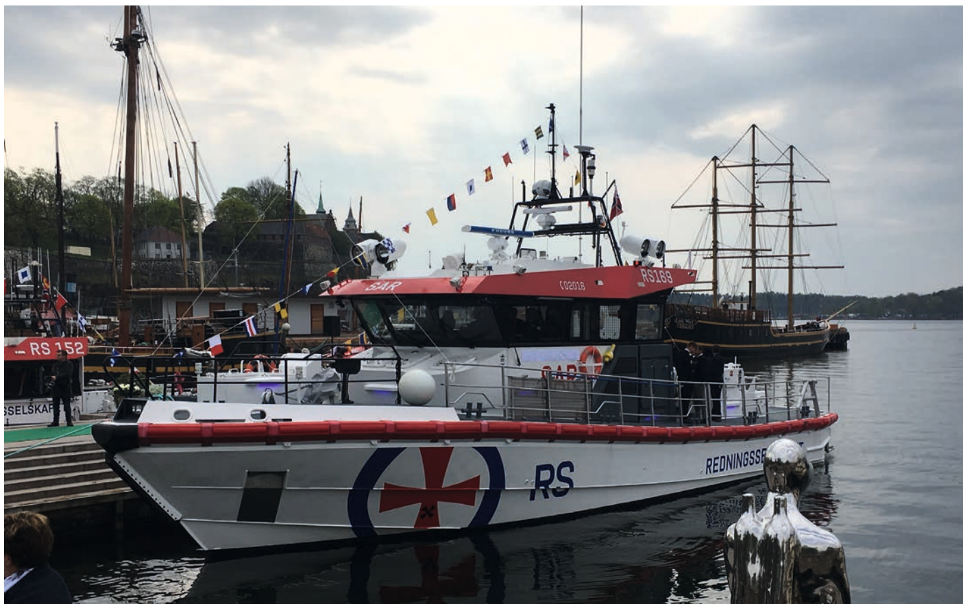
Her ser vi skipet som ligger ved Honnørbrygga i Oslo

Med disse ordene av Gudmor Wenche Myhre kan vi si at Landssaken for Odd Fellow kom vel i havn. Mange stolte deltakere møtte opp til den høytidelige handlingen på Honnørbryggen 26. april 2019 i Oslo. Etter ordene i overskriften fulgte: «Må hell og lykke følge deg og ditt mannskap i din ansvarsfulle gjerning langs den norske kyst».