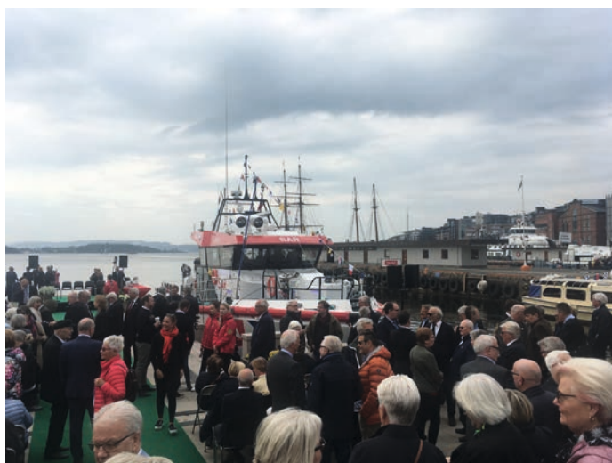
Mange var samlet under dåpsseremonien i Oslo

En bedre dag enn Ordenens 200-års dag kunne ikke ha blitt valgt for denne handlingen. Presis kl. 12.00 startet seremonien med en fanfare fra Marinemusikken og noen ord om Odd Fellow Ordenen kort fortalt av generalsekretær i