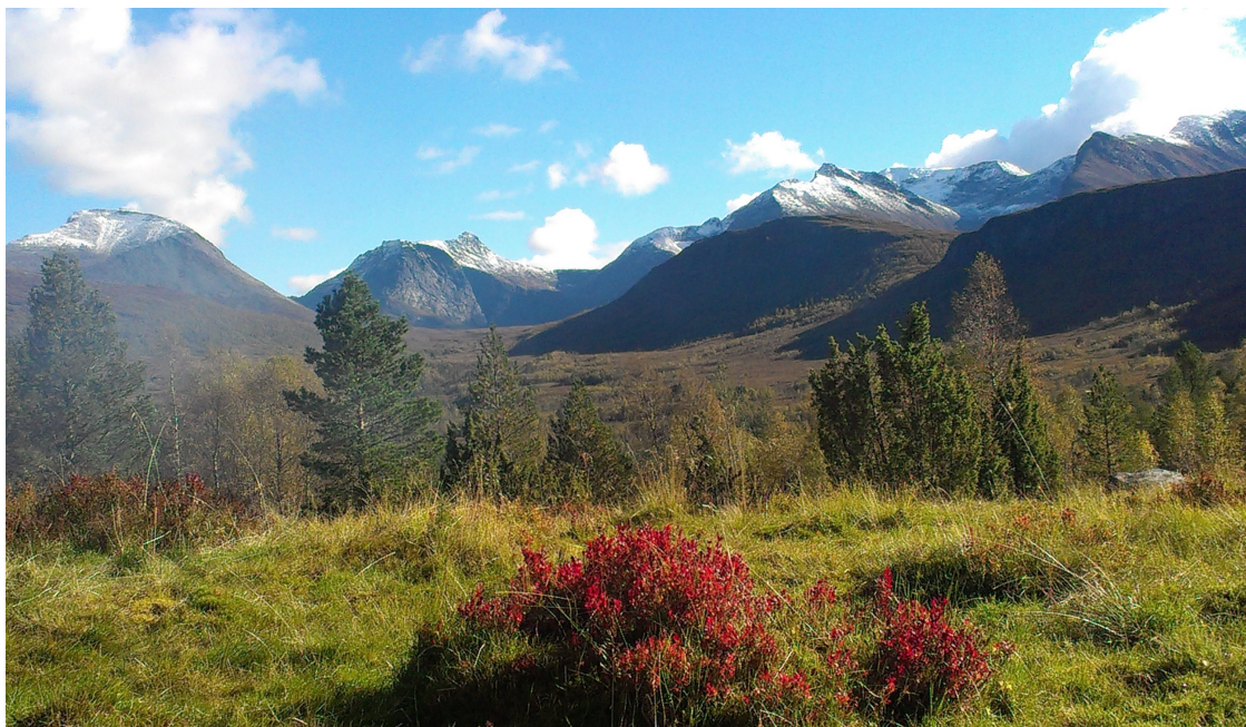
Utsikt fra hytta i Vaksvika

For å sitere Cicero: "Den som eier ei bokhylle og en hage – mangler intet"