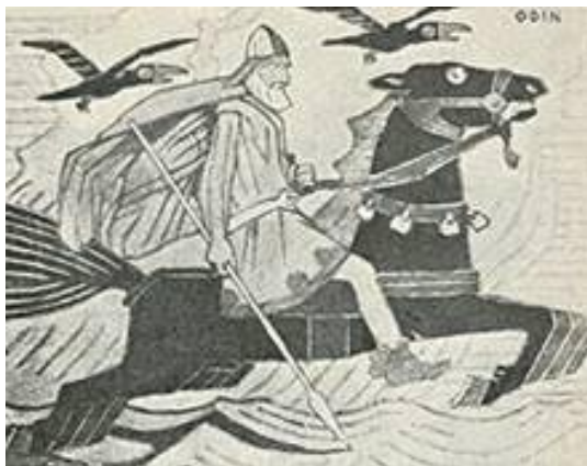
Odin på Sleipner med Hugin og Munin over seg.