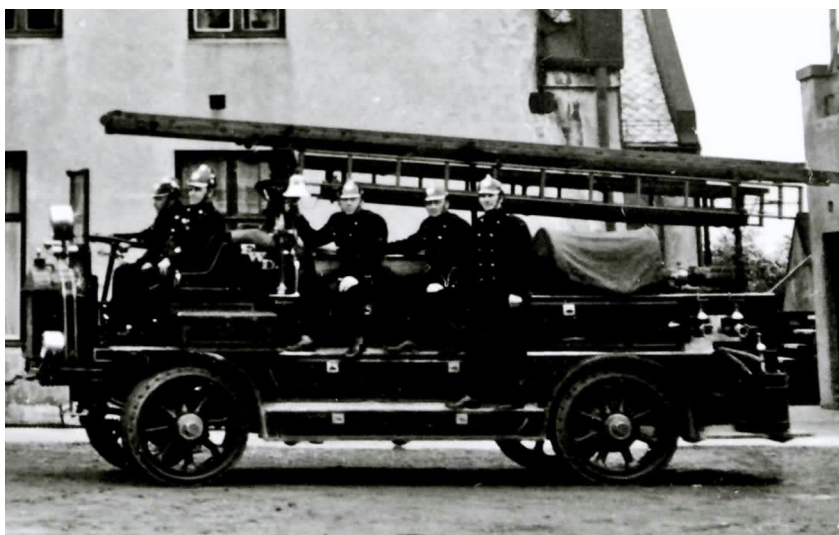
Ålesunds første brannbil. FWD 1927 modell.