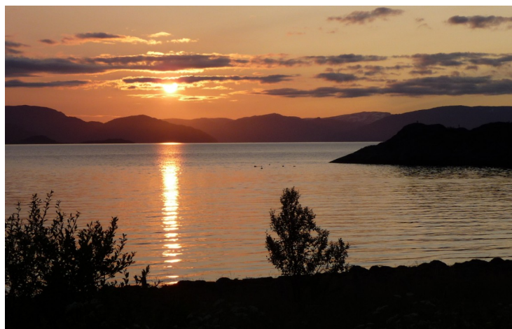
Utsikt nordover fra barnedoms-hjemmet

av familiene våre. Søster mi stiller med tre barn, barnebarn og oldebarn. Vi har klart å få med oss alle våre tre barn med følge og to barnebarn. Vi ser fram til dette. Jeg regner med at et slikt møte kun vil være er mulig å få til en gang i livet tatt i betraktning bosteder for de involverte.