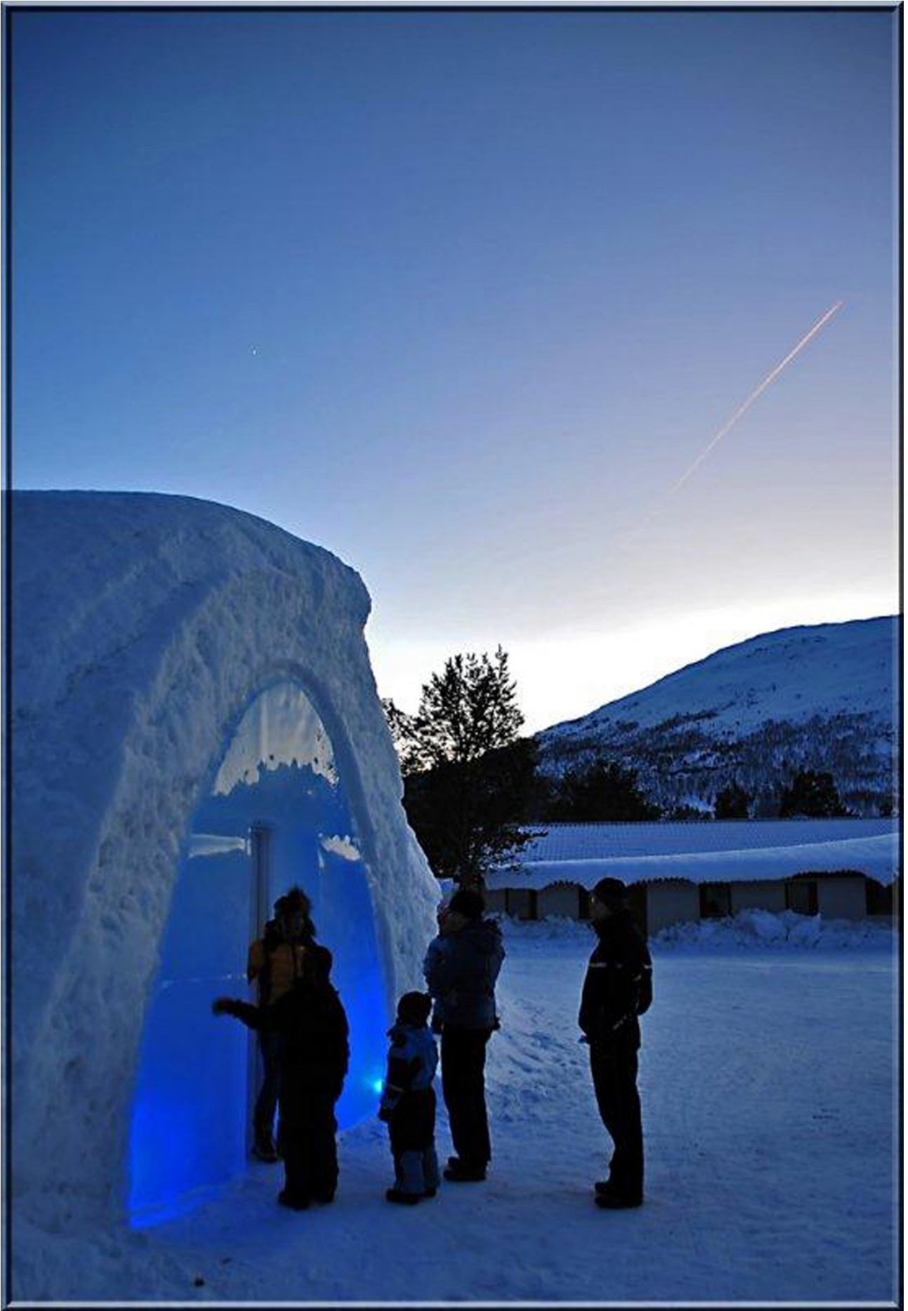
Ishotellet på Bjorli.