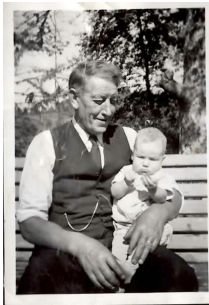
Bestefar og meg.

Begge mine besteforeldre på farssiden kom fra indre strøk. Farfar fra Hellesylt, far-