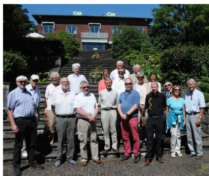
Deltagere fra Loge Skaugum med ledsagere på sommertur til Sandefjord. Her fra parken i Anders Jahres eiendom Midtåsen.

Årets sommermøte gikk av stabelen lørdag den 14.juni og sto i hvalens tegn. På Hvalfangstmuseet i Sandefjord fikk deltagere en grundig og god innføring i norsk hvalfangsthistorie. I tillegg fikk vi se mye av Sandefjord by og en visning av Anders Jahres praktfulle eiendom på Midtåsen med omvisning i parken. Middag ble servert i Sandefjords logelokaler med Loge nr 15 Kongshaug som vertskap. Her fikk vi omvisning i de praktfulle lokalene som er under oppussing.