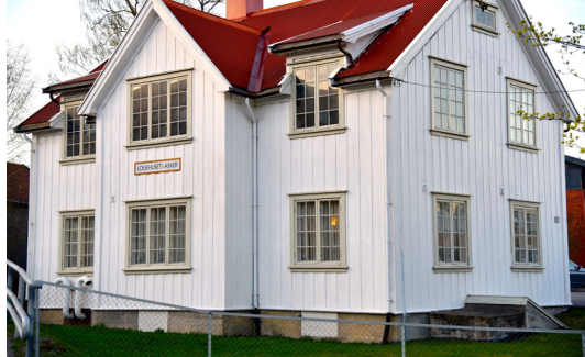
Losjehuset i Asker er ikke noe prangende bygg, men det er det innvendige som teller.

– Dersom vi ser området med Asker, Bærum, Røyken og Lier som et nedslagsfelt, så er det i dag over 200 000 innbyggere i denne regionen. Det gir et stort potensial for ekspans-