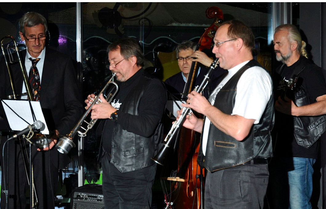
Strindens Provinceorchester lyste opp med svingende toner og trakk folk inn i Kulturhuset for å bli minnet på det viktige budskapet om å hjelpe trengende barn.

Odd Fellow Ordenen og SOS-barnebyer har inngått et tre år langt samarbeidsprosjekt, «Sammen for barn i Malawi». Medlemmer i Odd Fellow Ordenen fra hele landet skal i samarbeid med SOS-barnebyer finansiere byggingen av en ny SOS-barneby i Ngabu, som ligger i et av de fattigste områdene i Malawi.