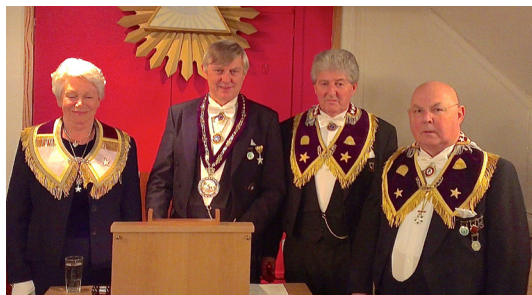
Stor Sire og Storembetsmenn klar til å foreta innvielse.

jon og utvikling, sa Morten Buan og presiserte at det bør være et langsiktig mål å tenke ekspansivt både med hensyn til Ordenslokaler og ytterligere knoppskyting i logesammenheng.