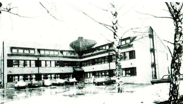
Odd Fellow-gården, Bleikerveien 17 i Asker