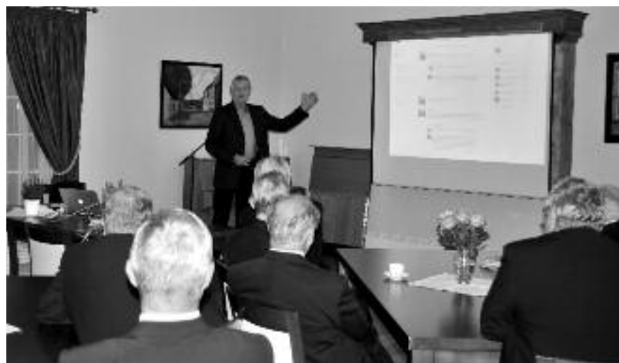
Professor i Vitenskap og Teknologi ved Universitetet i Oslo foredrar engasjerende om «Fra jordbruk til digitalt nettsamfunn».