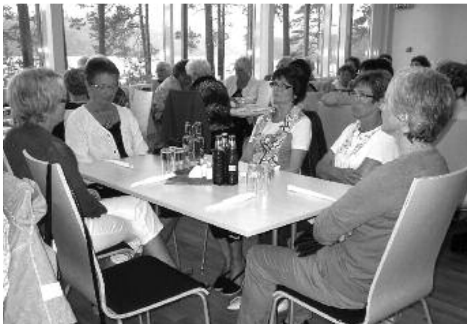
En fornøyd bukett Ceciliasøstre venter på servering.

Etter middagen fulgte en omvisning i hotellet. Det er 39 dobbeltrom og 5 suiter. Alle i duse, vakre farger, og de fleste med utsikt over sjøen.