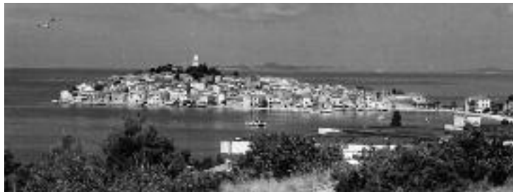
Primosten, tett bebygget og et kjent landemerke.

over 860 forskjellige planter, men det var de fantastiske bildene av vann og trær som gjorde størst inntrykk, og den nesten eventyrlige stien på flere kilometer som er bygd av trevirke gjennom området.