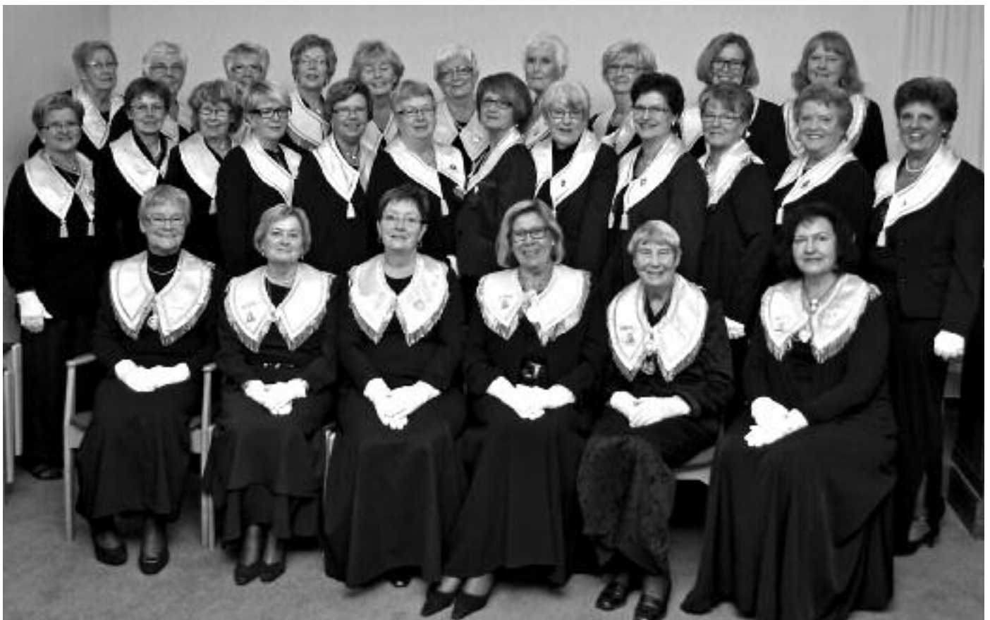
Våre svenske søstre samlet på «ett Brett».