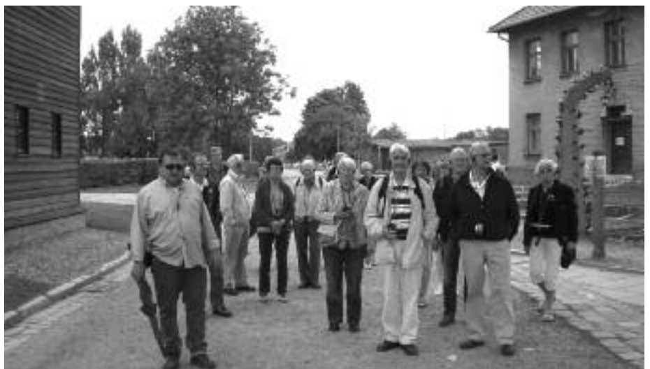
Vår flinke guide og en del av gjengen ved besøket i Auschwitz.

Her tok vi farvel med vår guide og spiste felles lunsj på en restau-