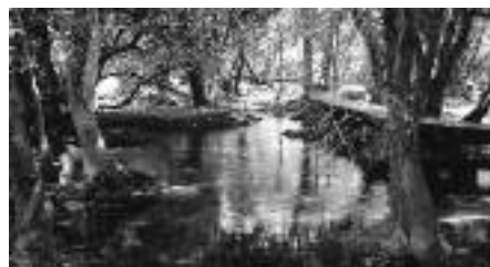
Nasjonalparken Krka med de bygde stiene som slynges seg kilometervis, ses til høyre på det nederste bildet.