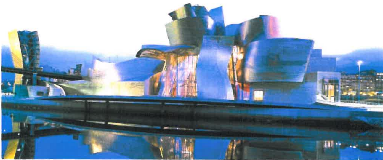
Guggenheim museet i Bilbao