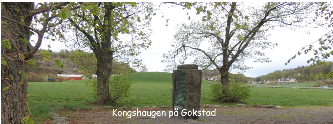
Kongshaugen på Gokstad