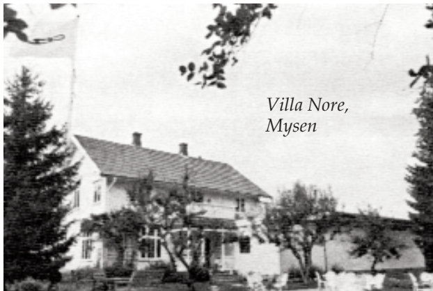
Villa Nore, Mysen