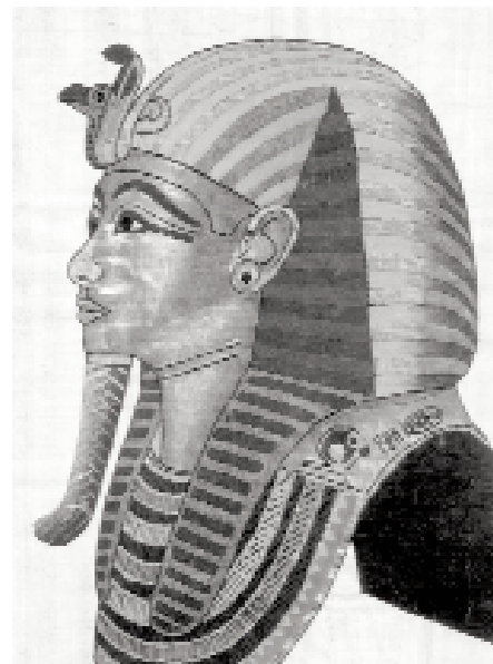
Tuth Ankh Amon

De som har lest boken eller sett filmen "Døden på Nilen" av Agatha Christie, har etter vår mening fått et godt og riktig bilde av en reise på Nilen om bord i dagens luksusskip. Nilen er en doven elv i den forstand at man knapt kan se at den beveger seg. Så er da også Egypt et meget flatt land. Nilen er landets viktigste naturressurs. 95% av landets 69 mill. innbyggere bor og lever langs elven, og her ligger de største byer, Kairo, Alexandria, Gisa og Aswan. Nilen, der hvor vi opplevde den, omtrent midt på, er ikke stort bredere enn hva Glomma er ved Grønnsund i Eidsberg. Under vår anden uke i Egypt hvor vi hadde en s.k. badeuke ved Rødehavet, fikk vi anledning til en to-dagersstur til Kairo hvor tre hove-