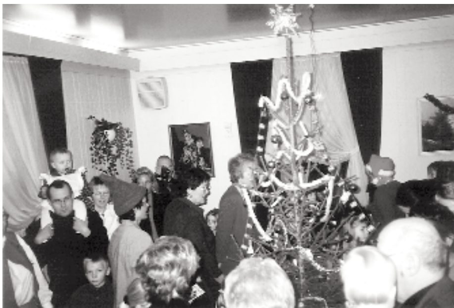
Julefest med gang rundt treet, slik tradisjonen tilsier.