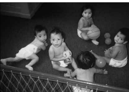
Dagbarn på Sosialsenteret.