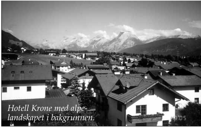
Hotell Krone med alpe-landskapet i bakgrunnen.