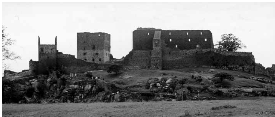
Festningen Christiansø ble bygget i slutten av 1600-årene.

Etter lunsj fikk vi også med oss Østerlars kirke (oppført ca. år 1200) – den største av Bornholms rundkirker. Noen kilometer bortenfor lå Nyker, den minste rundkirken på øya hvor vi satt ned mens guiden forklarte. Deretter besøkte vi et berømt glassblåseri hvor relativt mange av oss endte opp med den samme glassvasen og tilslutt inntok vi Hammershus festning. Vår lokale guide bandt det hele sammen og gjorde selv bussturene interessante med kommentarer og