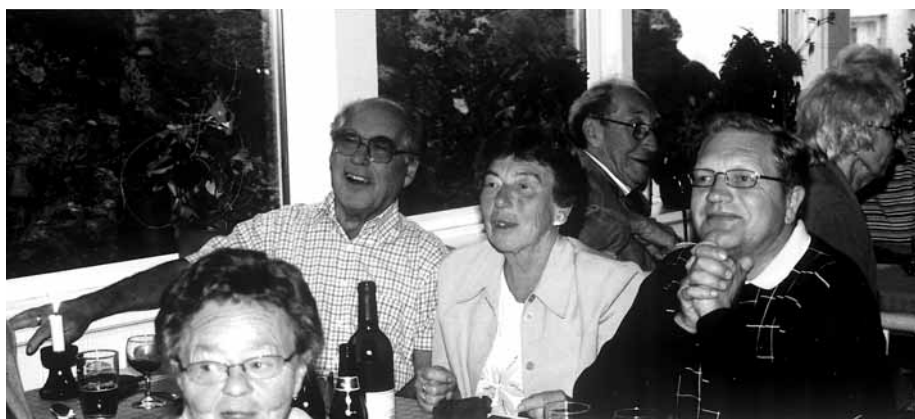
Blide, kjente fjes på Bornholm.

Men den neste dag, som hver dag forresten, ble vi vekket av kirkeklokkene kl. 0700 og til et nydelig vær og sjarmerende omgivelser som vi de neste 3 dagene skulle stifte nærmere bekjentskap med.