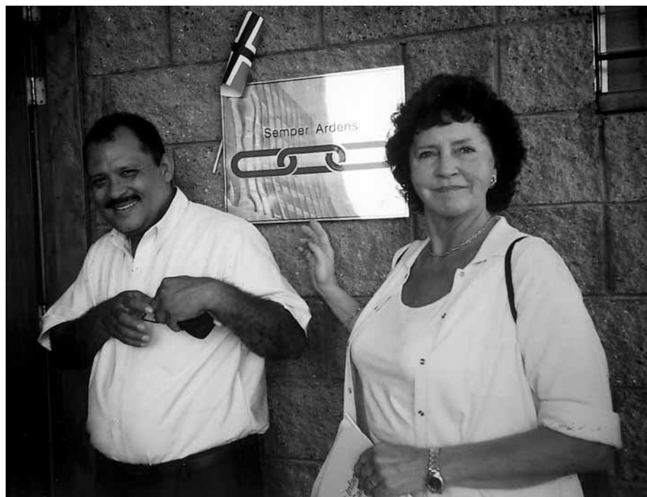
Artikkelforfatter og en av tolkene utenfor huset med navn: Semper Ardens (Rebekkaløge nr. 10 fra Moss).

Vi kom til El Salvador i stekende varme – 40 grader – møtt av representanter fra de lokale og internasjonale SOS-Barnebyer. Vi ble kjørt direkte til hotellet i hovedstaden San Salvador, hvor det sto bevæpnede vakter utenfor inngangen. Vakter med maskingevær stod det på nesten hvert gatehjørne og det