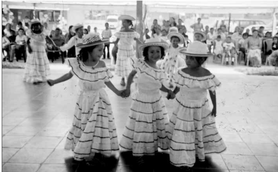
Underholdning av noen av barna som bodde i barnebyen.

Dette var i forkant ikke bestemt , for det skulle ikke være noen konkurranse. I etterkant ble det bestemt at de 6 Odd Fellow loger og 6 Rebekkaloger, som hadde samlet inn de største summene, skulle få sitt navn på husene.