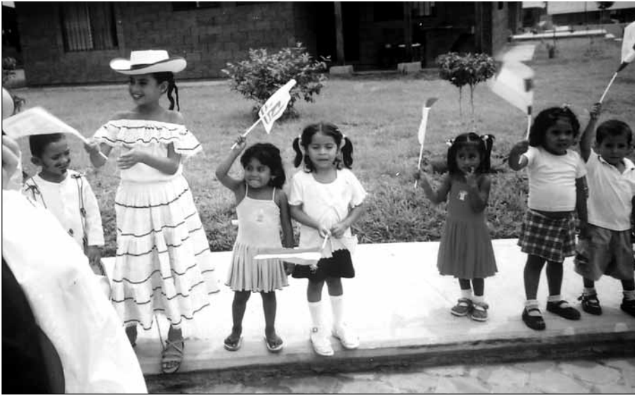
Barna ønsker velkommen til Odd Fellow Barnebyen i San Vicente i El Salvador, 7. mai 2005.

hvert enkelt barn, slik at de som voksne kan klare seg selv. En nøkkel til en bedre fremtid både for barna og landet de bor i.