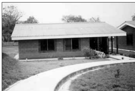
Ett av de 12 familiehusene.

Barna var stolte av hjemmet sitt – de dro oss inn for å vise at de hadde egen seng, eget skap med klær og leker og de hadde "MOR". Det var rørende å se hvor glade de var.