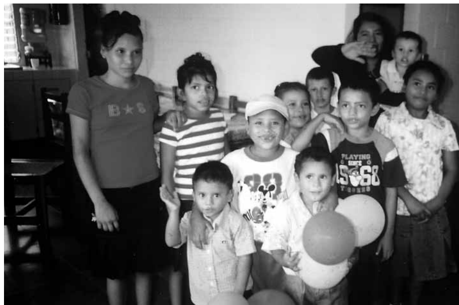
En barneby-mor med «sine» barn.

var strengt forbudt å forlate hotellet uten følge. Fattigdommen er enorm der borte og El Salvadors kriminelle miljø skaper store problemer.