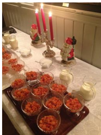
Sørøyamulter - ser det ikke godt ut?

For de som hadde tid og anledning, ble det en varm lunsj i logen dagen etter!