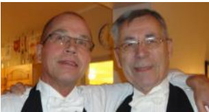
Kokken (t.v.)og Medhjelperne. (under)