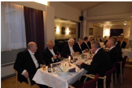
Noen av de tilstedeværende brødre