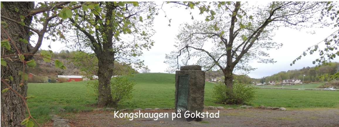
Kongshaugen på Gokstad