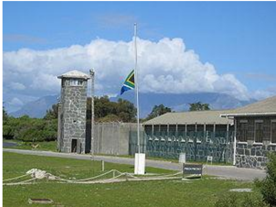
Inngangen til fengslet.

Robben Island er en øy 12 km utenfor Cape Town. Ordet Robben kommer fra nederlandsk og betyr sel.