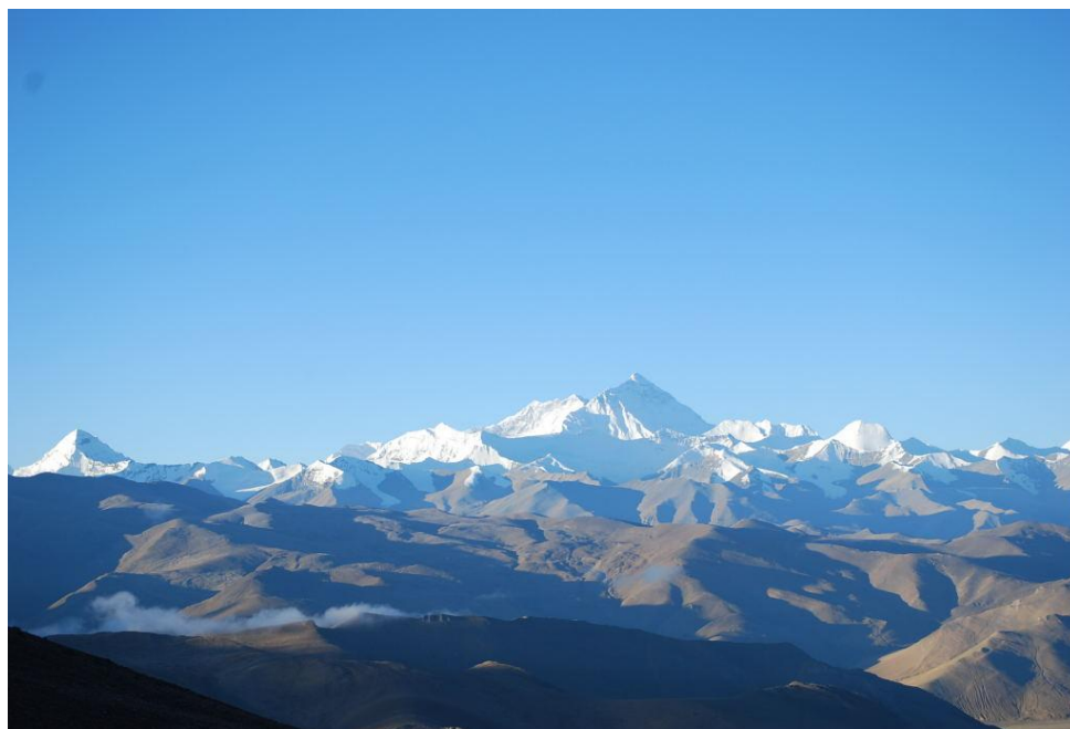
Himalaya, et vakkert skue fra Jo-ala passet på vei inn mot Base Camp. Høyde 5800 m.o.h.

Vi reiste neste dag med bil fra Lhasa i retning mot Mt. Everest. Første overnatting var i Shigatse. Her begynte vi å få en forsmak på hva som kom. Det er ikke normalt med innlagt vann og strøm utenfor de «store» byene. Det var generelt veldig dårlig renhold, også på de såkalte restauranter. Jeg bare nevner at de har toaletter på disse stedene også, hull-i-gulvet-typen, uten vann. En Tibetaner vasker seg ikke mer enn en gang om året, dersom han skal på fest. Dersom de vasker seg oftere vil fettlaget på huden vaskes bort og de fryser. Maten var smakløs, krydder vet de ikke hva er. Suppe var bare vann tilsatt noe (vil helst ikke vite hva). Siste hotellet vi lå på var i byen Dingri. Strømmen til dette hotellet kom fra en generator/dieselaggregat i bakgården. Den ble startet i forbindelse med frokost om morgenen og til middag om kvelden. For vandring på hotellet utenom de tidene var lommelykter og levende lys eneste alternativ. Fra Dingri til Base Camp var vi innom 5 forskjellige sjekkpunkter på en vei uten tilknytning til andre veier.