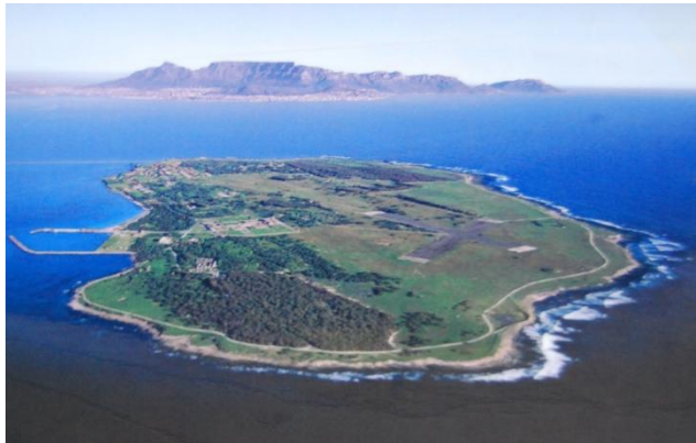
Her ser vi Robben Island og fastlandet med CapeTown og det kjente Table Mountain i bakgrunnen.

Historien om øya: Fra slutten av 1700-tallet har øya blitt benyttet til å isolere mennesker fra omverdenen, først og fremst som fengsel. Mellom 1836 og 1931 ble øya benyttet som tuberkulosesanatorium, og senere fengsel for politiske fanger fra Sør-Afrika. De mest kjente var Nelson Mandela, og andre ANC-ledere, Walter Sisulu, Govan Mbeki og Robert Sobukwe.