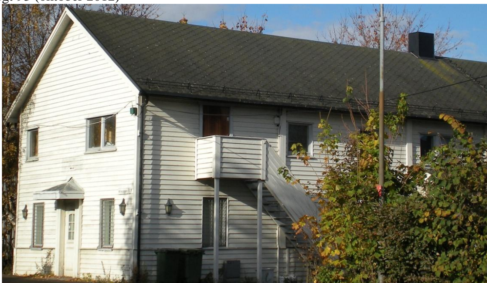
Nittedalsgt 93 (oktober 2012)