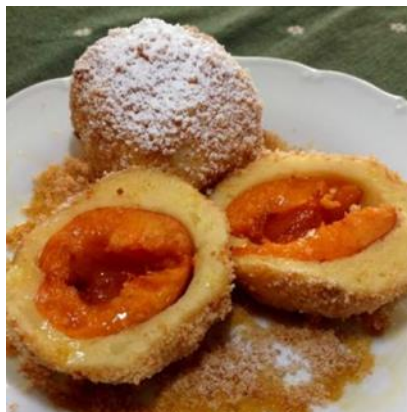
En typisk Marillen ( Aprikosen) Knødel