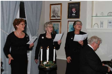
Og selvsagt ingen julefest uten Lucia.