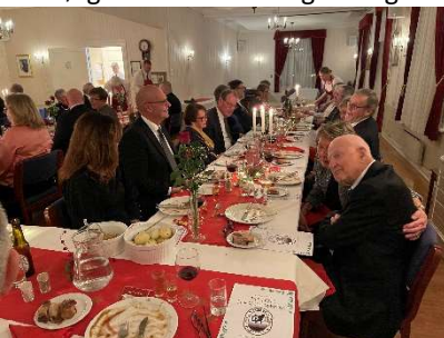
Bilde fra julemiddagen

Årets Julemøte ble en stor suksess. Bordene var pent pyntet til julefest og brødrene var feststemte sammen med sine følger. Vi koste oss i godt lag.