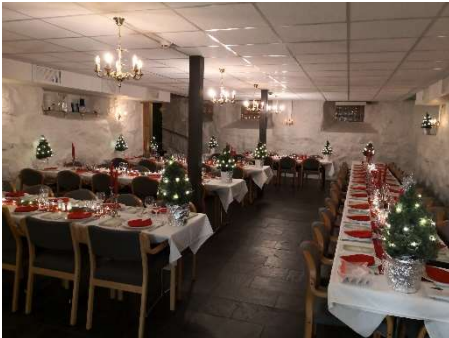
Etter julemiddagen var det mer sang og underholdning.

Etter møtet var det nydelig julemat i et flott pyntet rom.