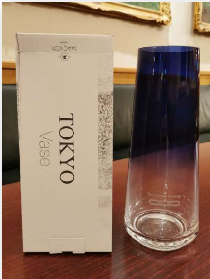
Jubileumsgaven fra Stor Sire og Den Norske Storloge. Inskripsjon: Den Norske Storloge og De Tre Kjedeledd.