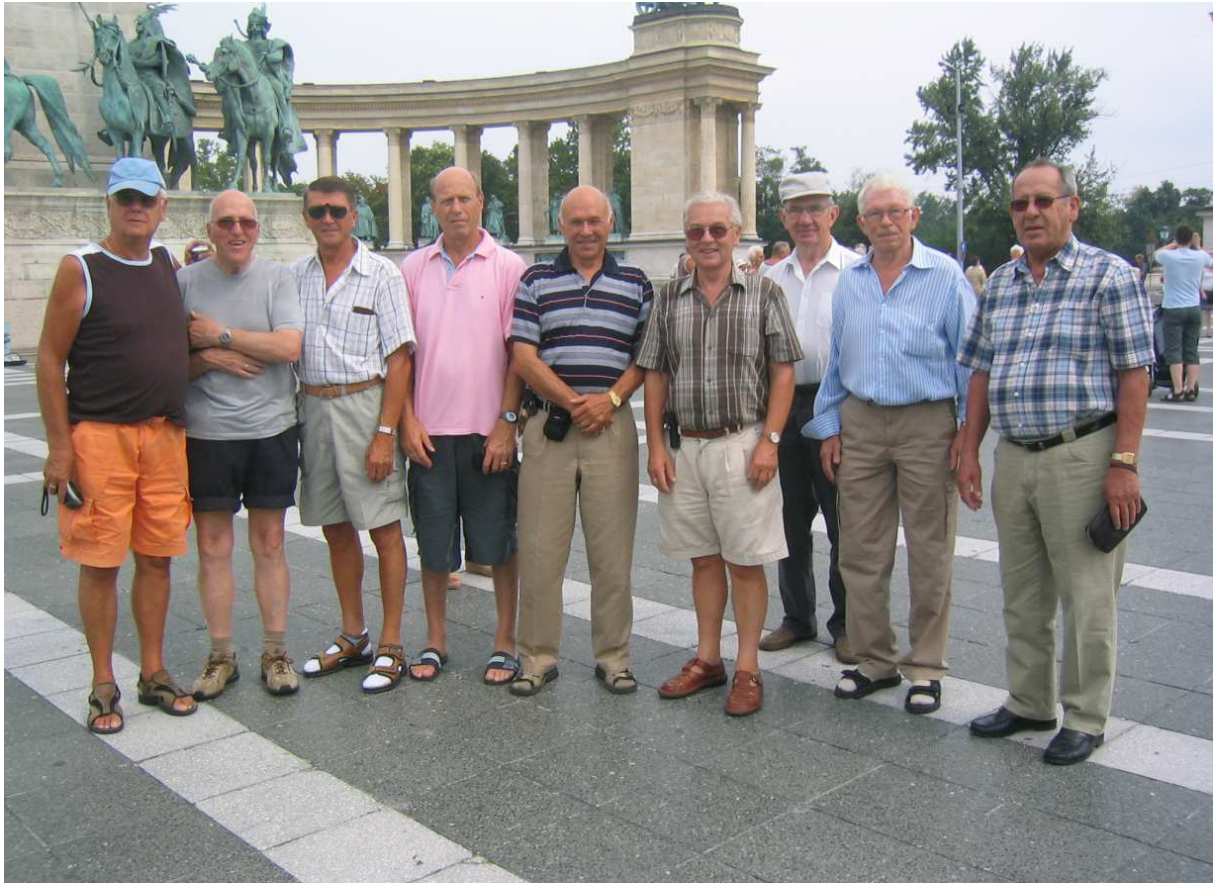
Noen av brødrene på Heltenes plass i Budapest