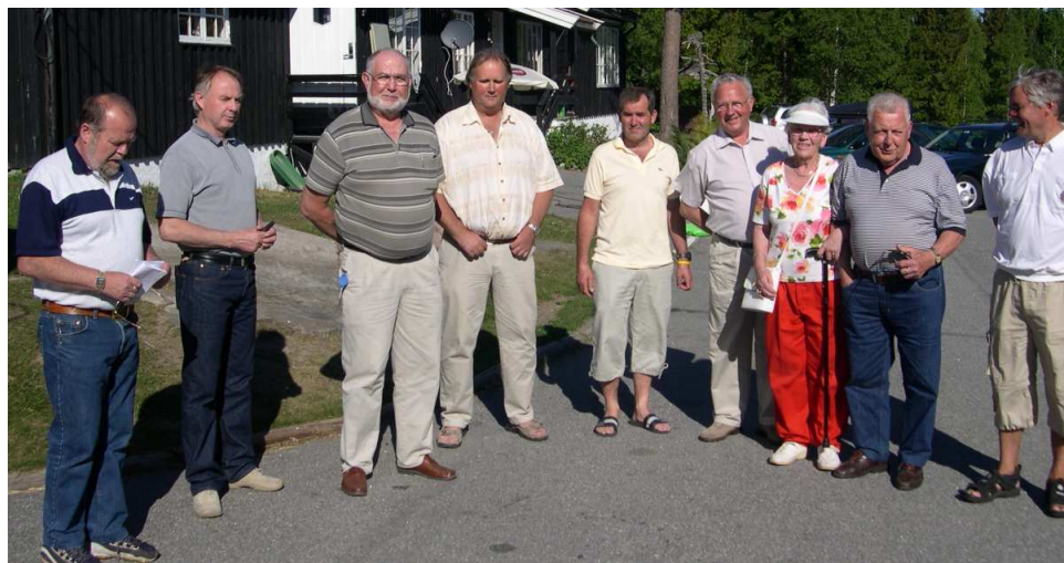
Sjåførene som deltok på turen ut i det blå til Vindfjelltunet