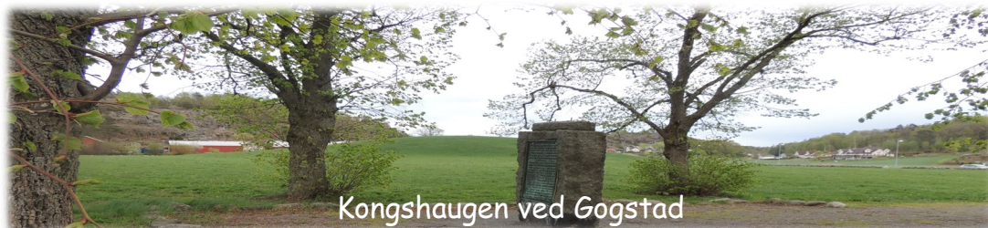
Kongshaugen ved Gogstad