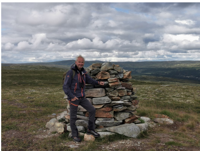
Tekst og foto Arild L

Innimellom raseriutbruddene til «Hans», så var det mulig å bevege seg ute i den flotte naturen rundt hytta og det ble noen vandringsturer. Alt i alt, så hadde vi en kjempeflott tur på tross av mangel på fisk og «Hans» sin tilstedeværelse. Det finnes få ting som gir mer glede og gode minner enn å være tilstede i naturen og sammen med gode venner. Forfatteren er i alle fall takknemlig for å igjen ha fått delta i opplevelsene.