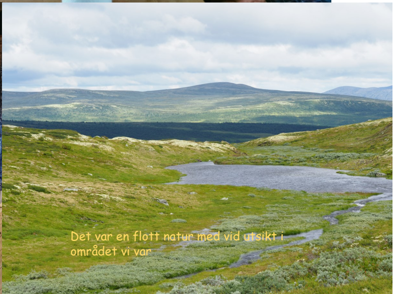
Det var en flott natur med vid utsikt i området vi var