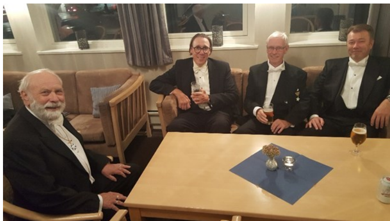
Besøkende brødre fra Loge nr. 17 Dag