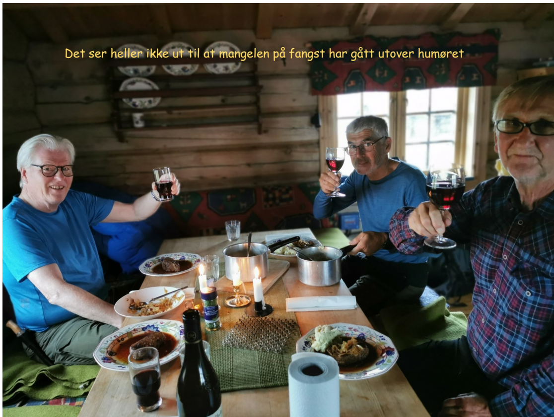
Det ser heller ikke ut til at mangelen på fangst har gått utover humøret