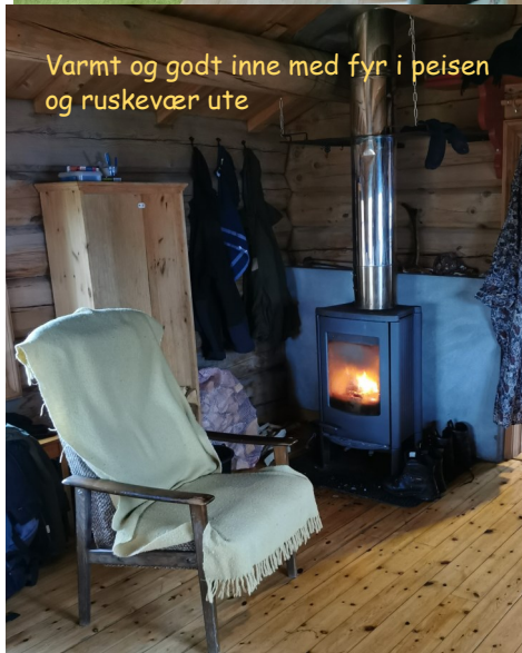
Varmt og godt inne med fyr i peisen og ruskevær ute