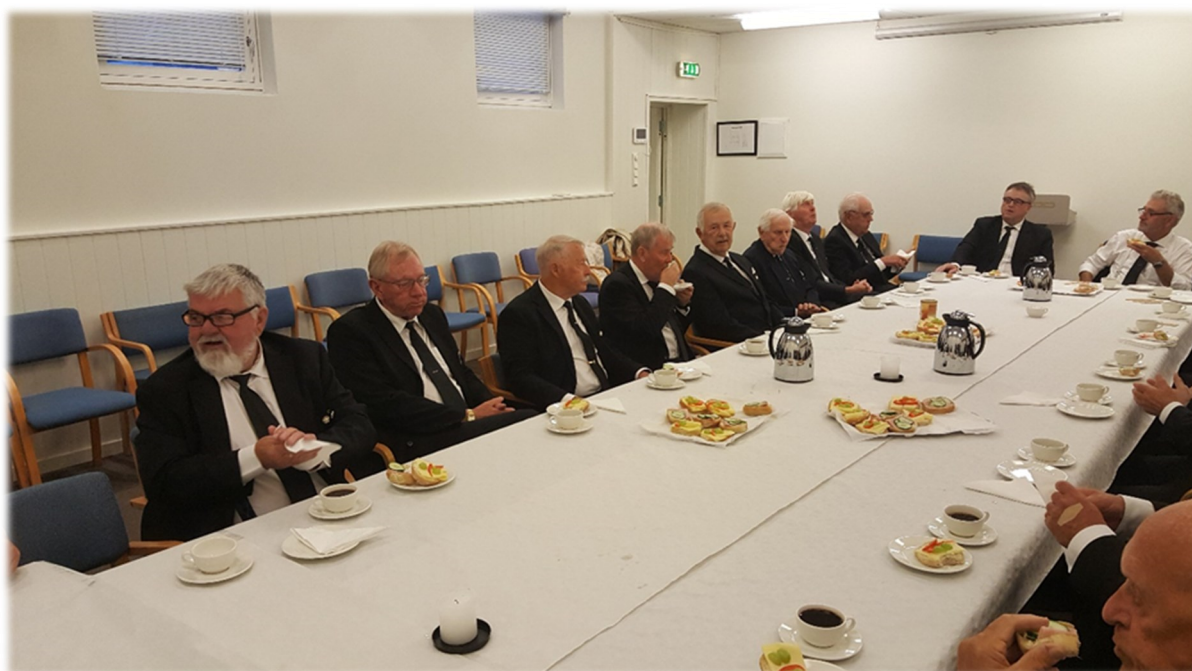
Øverst til venstre; Utlodning er populært Øverst høyre; Samling foran krigsminnesmerket Nederst; Trivelig samling med påsmurte snitter og kake