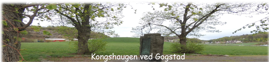
Kongshaugen ved Gogstad