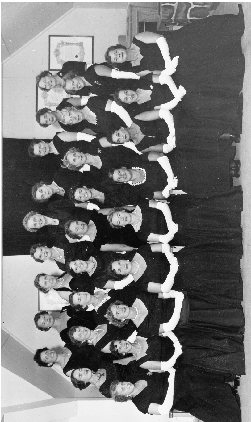
Bilde av søstrene ved institutteringen 1. juni 1957