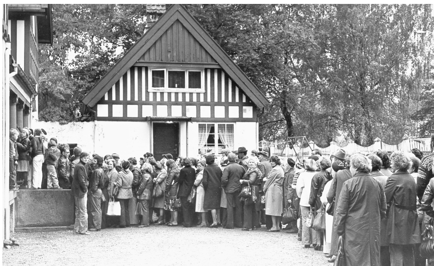
Fra køen i gården 1979

Vårt årlige loppemarked ble holdt 15. og 16. oktober og som vanlig var det lang kø før vi åpnet kl.10.00. Søstrene som stod i døra hadde sin fulle hyre med å holde orden i rekkene da det oppsto nærmest slåsskamp mellom noen av de besøkende. Loppene gikk unna og i løpet av disse to dagene kom det inn kr. 15 000,-