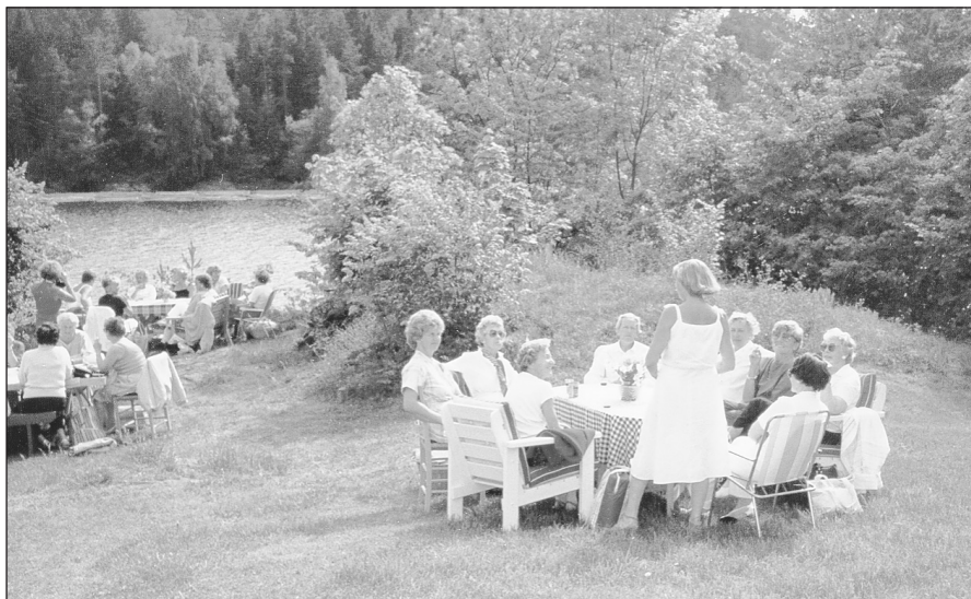
Sommertur til Rugla 1985

Som avslutning på vårterminen arrangerer logen hvert år en sommertur. Denne utflukten er i uformelle former og går til steder i nærmiljøet eller til en av søstrenes sommersted. Konkurranser og spill inngår i programmet, og ellers sosialt samvær.