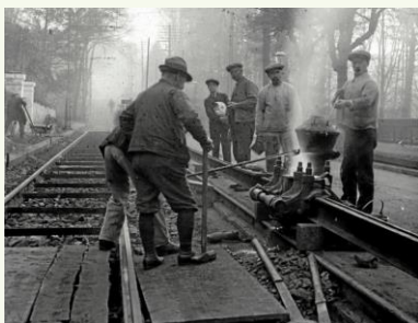
SPORET: Bergen Sporvei i arbeid i Kalfarveien. Bildet er fra før 1920.